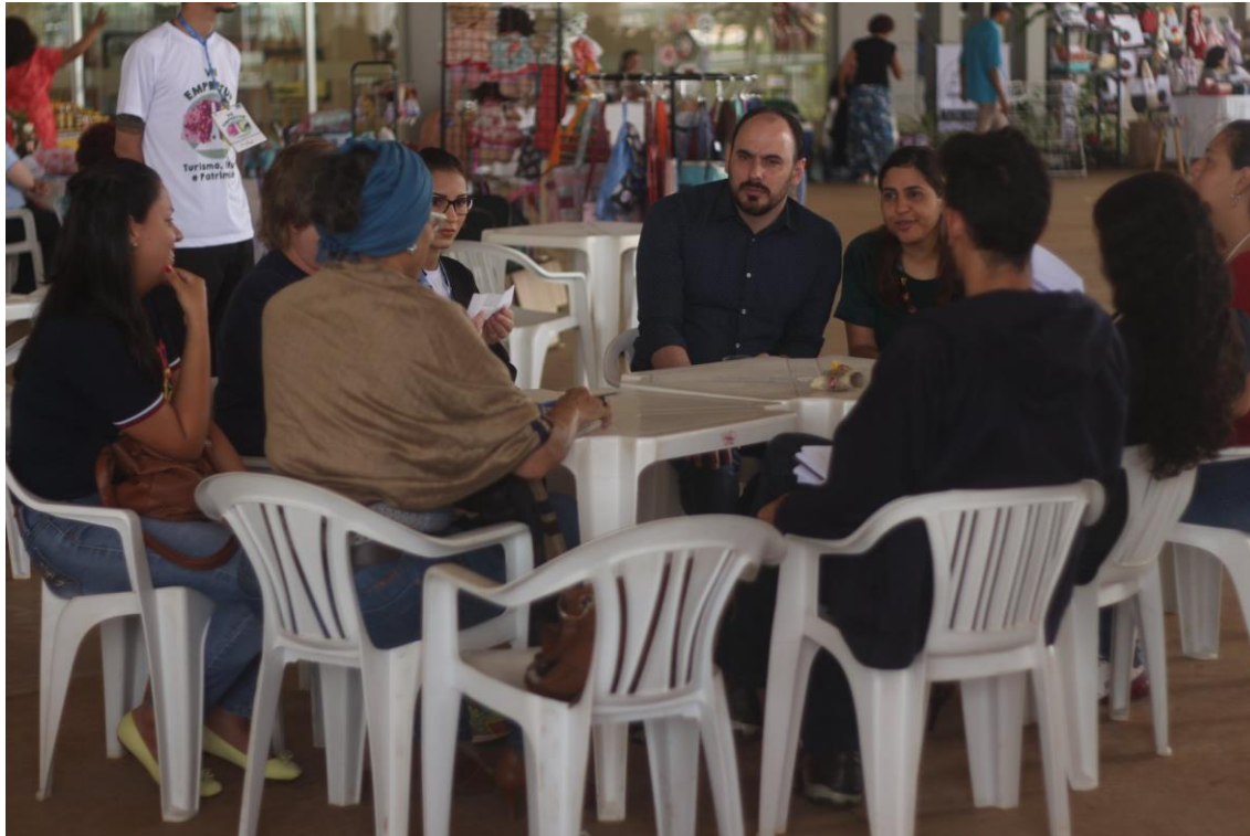
Grupo espalhados na área da universidade para desenvolver proposta cultural empreendedora na área de turismo.