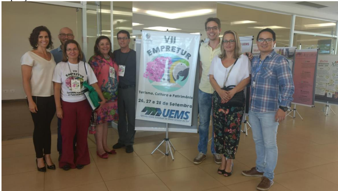
Docentes do Curso de Turismo da UEMS – Unidade Universitária de Campo Grande/MS