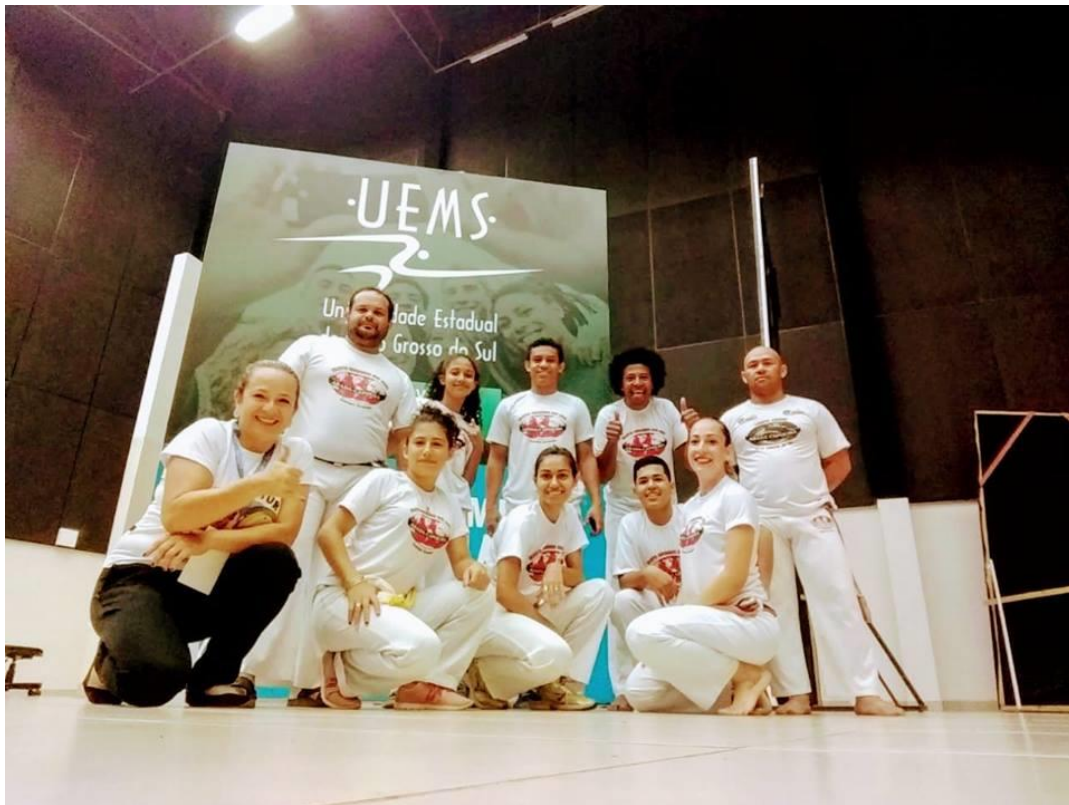
Apresentação do Grupo de Capoeira Abadá na abertura do VII EMPRETUR/2018.