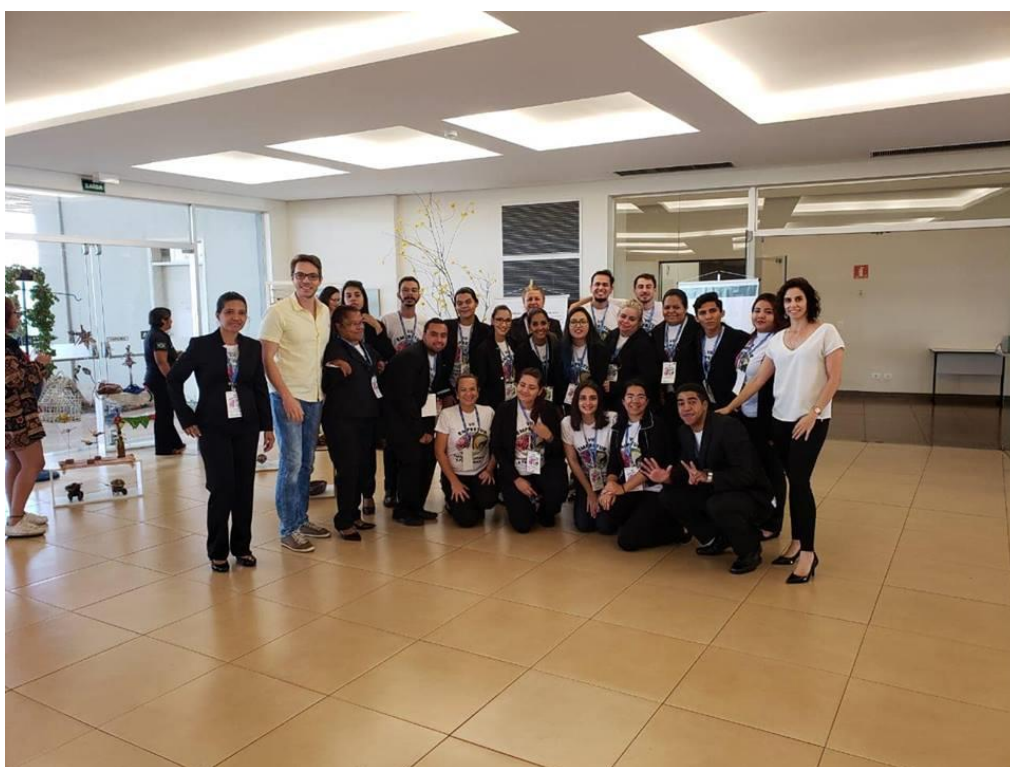
Comissão Organizadora e Docentes - EMPRETUR -2018.