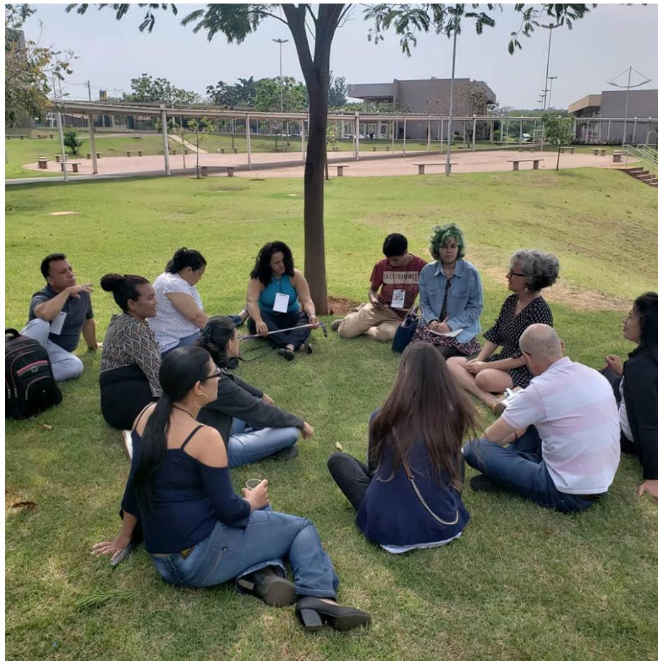
Grupo espalhados na área da universidade para desenvolver a proposta cultural empreendedora na área de turismo.