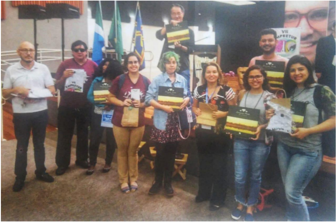
Ganhadores dos brindes no sorteio durante o VII – EMPRETUR 2018.