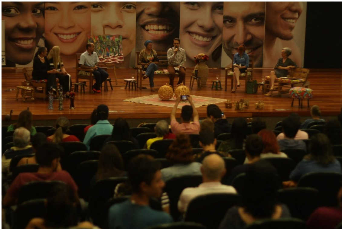
Palestra Empreendedorismo Cultural durante o EMPRETUR 2018