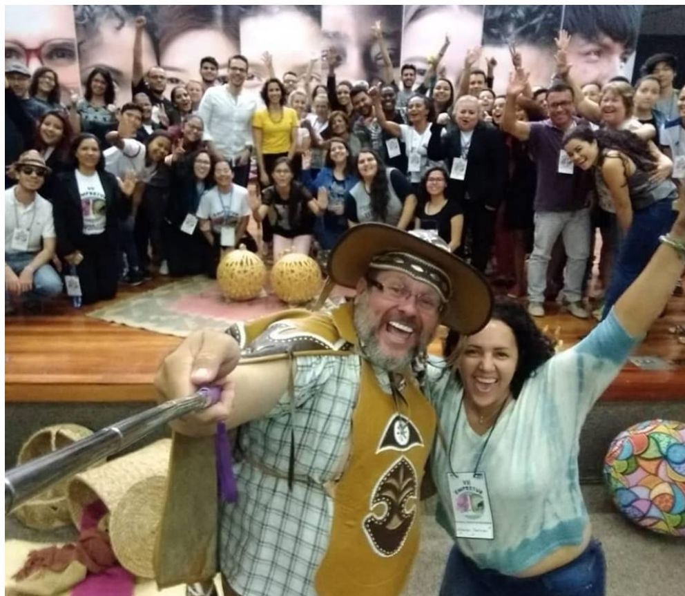
Encerramento do EMPRETUR 2018