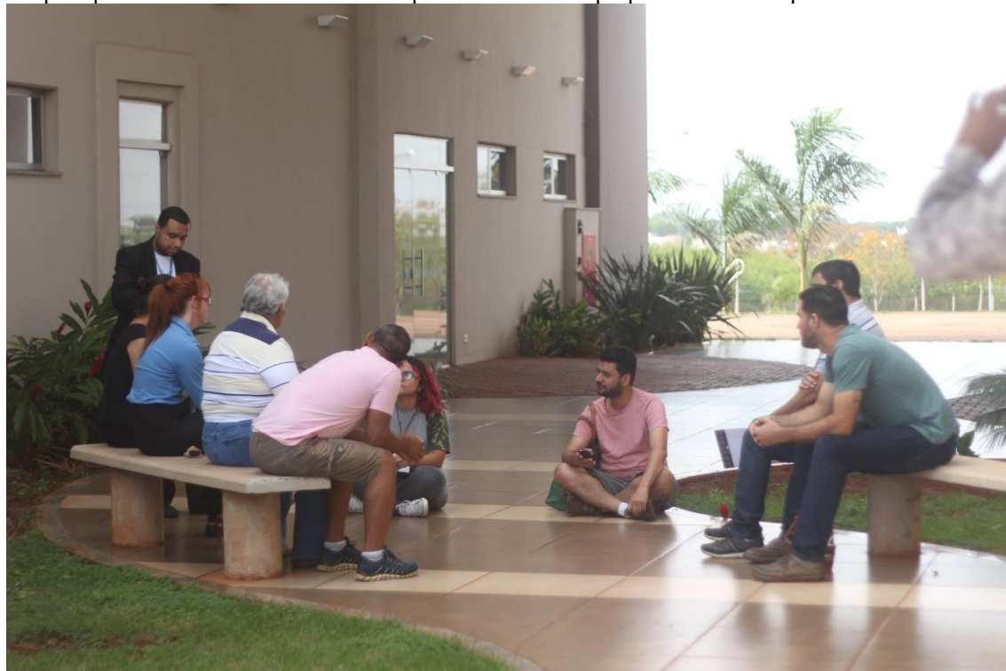
Grupos espalhados na área da universidade para desenvolver proposta cultural empreendedora no turismo.