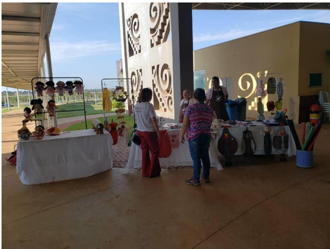
Feira cultural empreendedora do VII EMPRETUR - Hall de entrada da Unidade Universitária de Campo Grande.