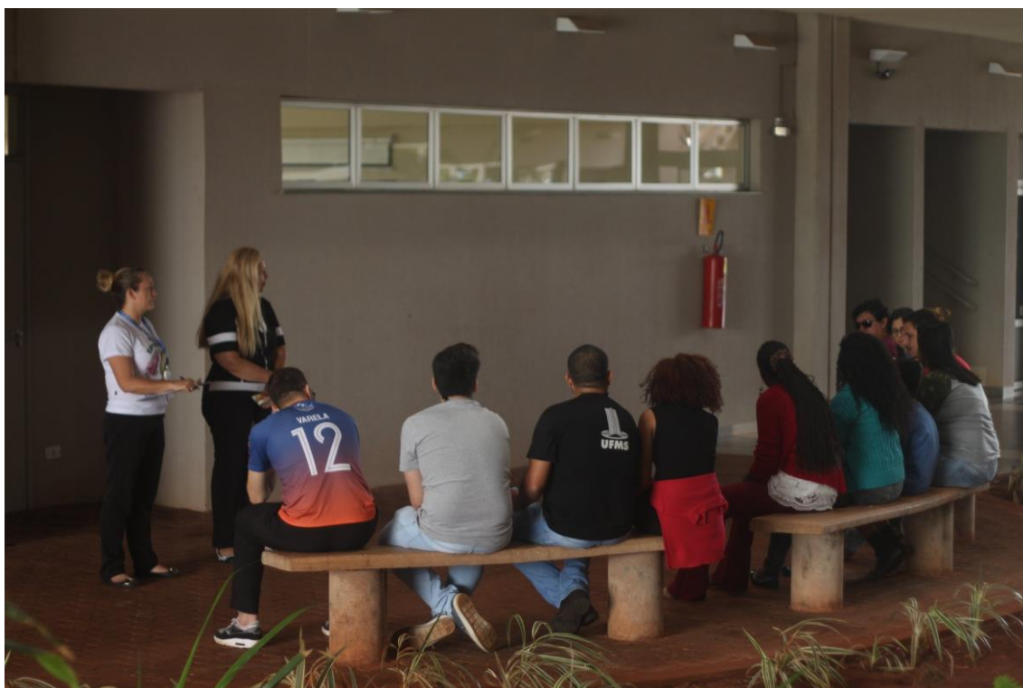
Grupo espalhados na área da universidade para desenvolver proposta cultural empreendedora na área de turismo.