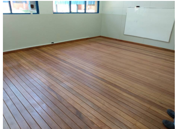
Imagem 26 Reforma e instalação de piso de madeira na sala do Mestrado em Saúde – U U Dourados