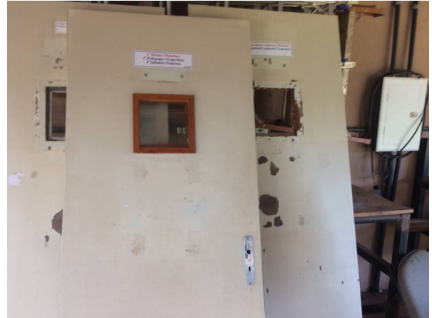
Imagem 20. Pintura de salas de aula e substituição de portas – U U Dourados