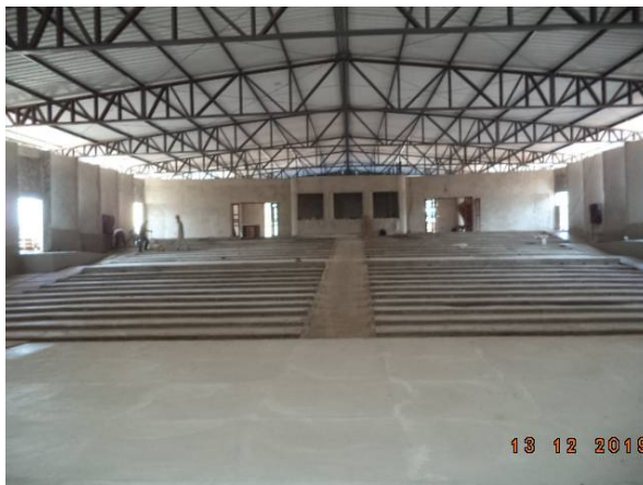
Imagem 09. Construção do Auditório - U U Dourados