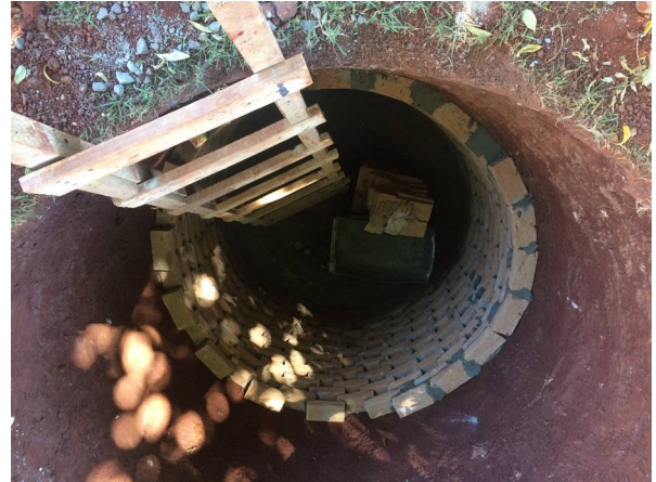
Imagem 24. Construção de conjunto de Fossa - U Dourados