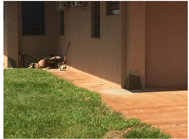
Imagem 12. Adequação de água fluvial do LAMAE e LABECO - U U de Dourados