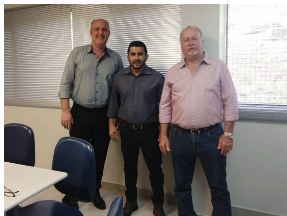
Reunião para discutir a possibilidade de recursos para implantação de um sistema de energia solar fotovoltaica