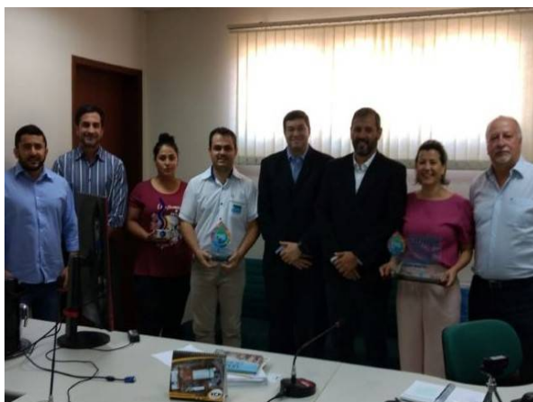
Reunião para discutir implantação do projeto “Da pena alternativa criminal às tecnologias sociais”.