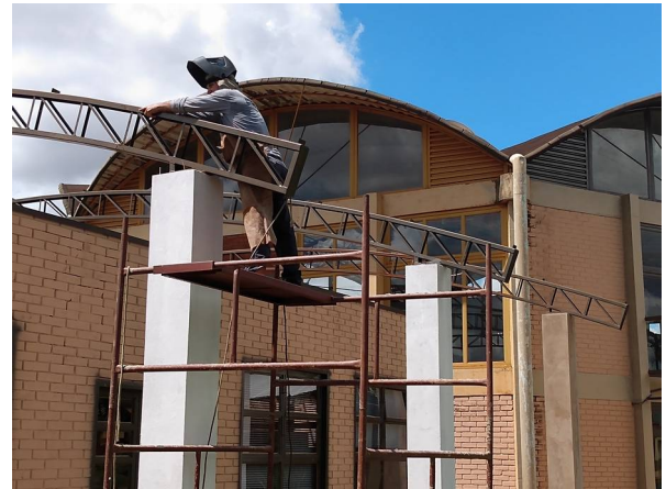
Imagem 18. Instalação de cobertura e reboco de pilares do Laboratório de Biologia/CERNA - U U de Dourados