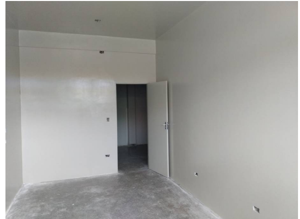
Imagem 16. Adequação com instalação de paredes em alvenaria do Laboratório de Física Bloco - U U Dourados