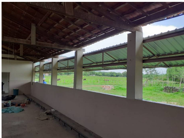
Imagem 03. Aumento do telhado e cocho de alimentação - U U de Aquidauana