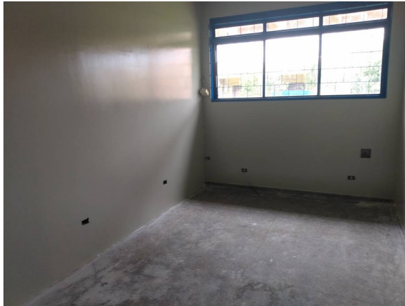
Imagem 15. Adequação com instalação de paredes em alvenaria do Laboratório de Física Bloco - U U Dourados