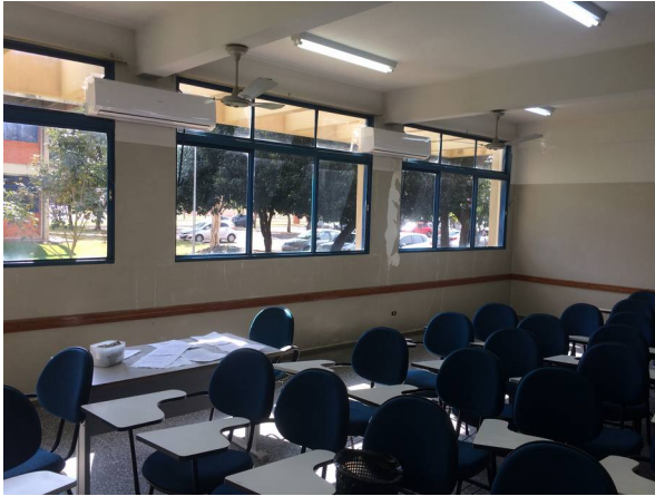
Imagem 19. Pintura de salas de aula e substituição de portas – U U Dourados