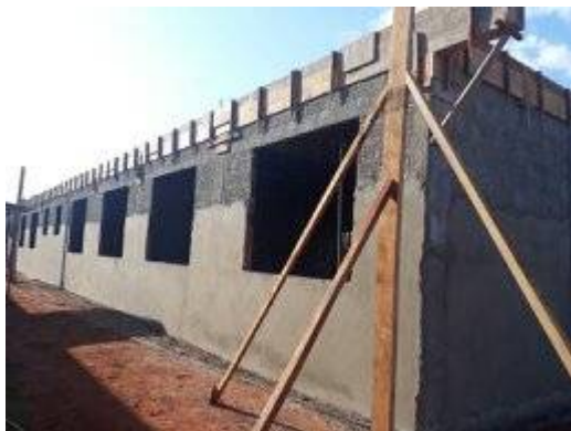
Imagem 35. Laboratório de Pesquisa – U U Mundo Novo