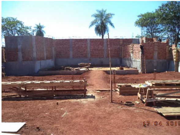
Imagem 07. Construção do Auditório - U U Dourados