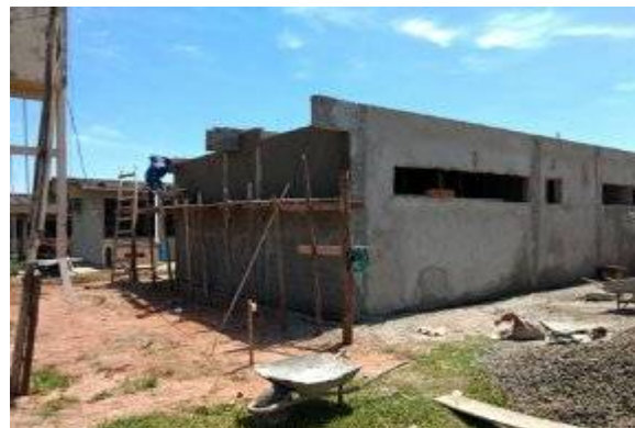
Imagem 36. Laboratório de Pesquisa – U U Mundo Novo