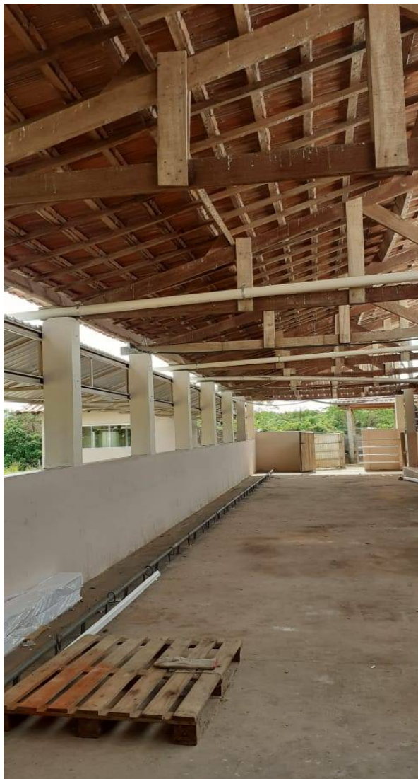
Imagem 01. Adequações do Setor de Gado de Leite - U U de Aquidauana