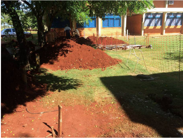
Imagem 23. Construção de conjunto de Fossa - U Dourados