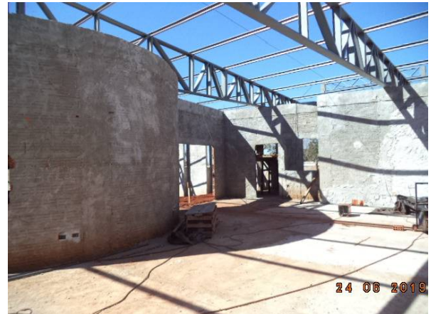
Imagem 08. Construção do Auditório - U U Dourados