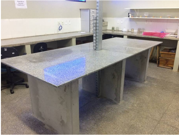
Imagem 31. Instalação de bancadas do LABECO - U U Dourados