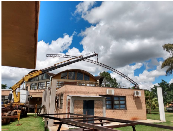
Imagem 17. Instalação de cobertura e reboco de pilares do Laboratório de Biologia/CERNA – U U de Dourados