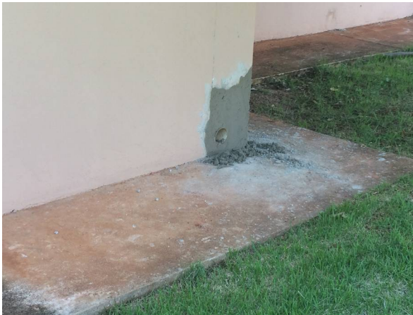
Imagem 11. Adequação de água fluvial do LAMAE e LABECO - U U de Dourados