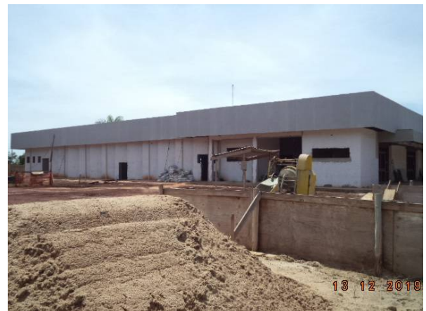
Imagem 10. Construção do Auditório - U U Dourados