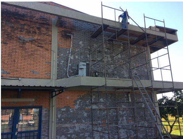
Imagem 21. Correção de infiltrações e reboco do Bloco C – U U de Dourados