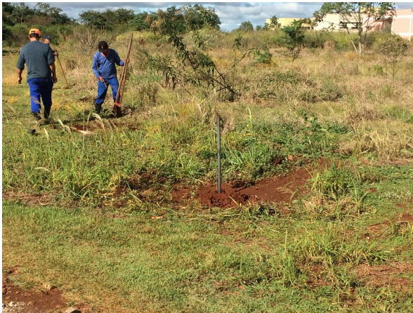
Imagem 29. Plantio de Mudas U U Dourados