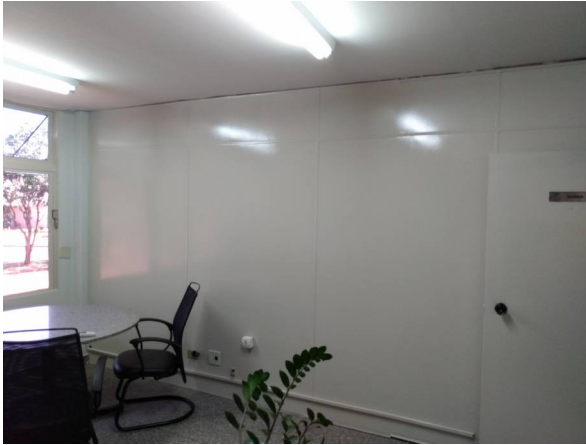
Imagem 13. Adequação e Pintura da Reitoria - U U de Dourados