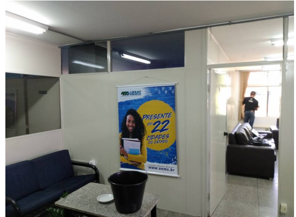
Imagem 14. Adequação e Pintura da Reitoria - U U de Dourados