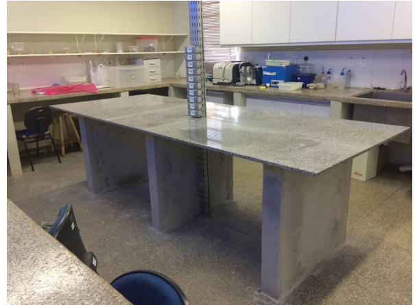
Imagem 32. Instalação de bancadas do LABECO - U U Dourados