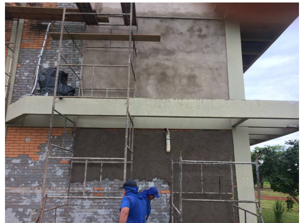
Imagem 22. Correção de infiltrações e reboco do Bloco C - U U Dourados