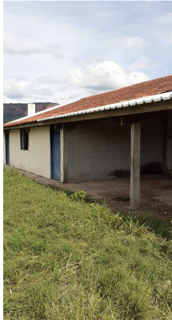
Imagem 02. Adequações do Setor de Gado de Leite - U U de Aquidauana