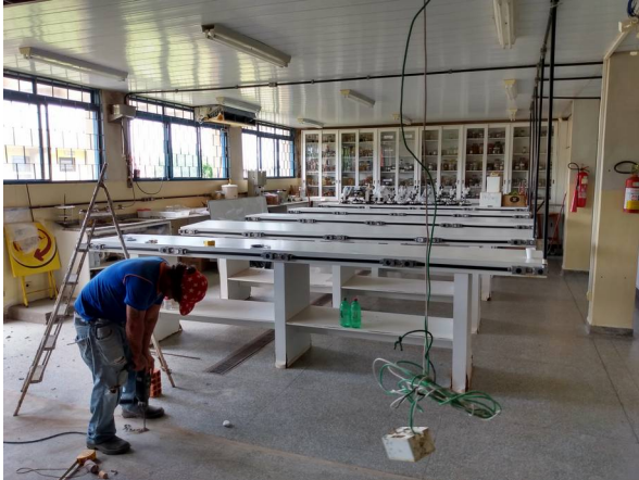
Imagem 27. Execução de parede de alvenaria e instalação de lousa no laboratório de Zoobotânica – U U de Dourados