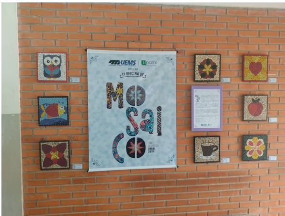
Imagem 33. Apoio à exposição de trabalhos da 1ª Oficina de Mosaico, UEMS-UNAMI - U U Dourados