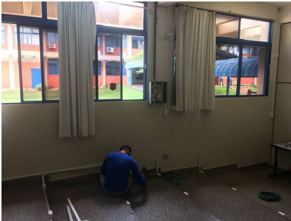
Imagem 25. Reforma e instalação de piso de madeira na sala do Mestrado em Saúde – U U Dourados