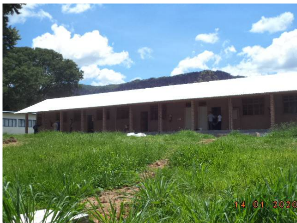
Imagem 05. Construção do Centro de Pós-Graduação em Agronomia - U U Aquidauana