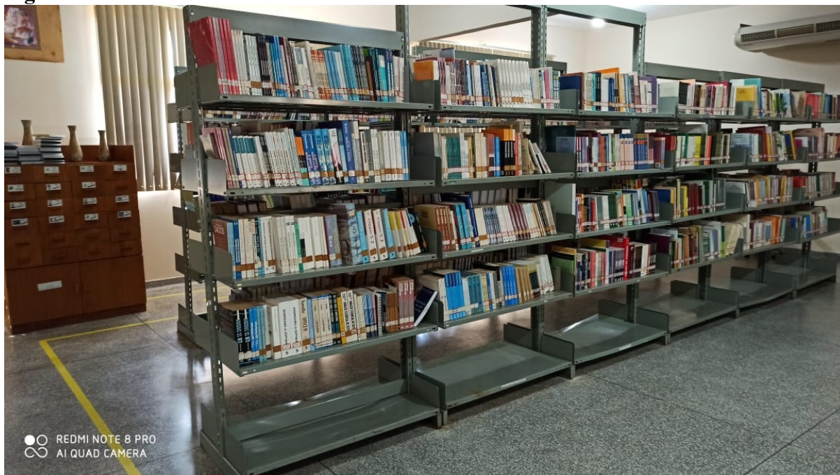
Figura 03 – Sala do acervo da Biblioteca da UU de Glória de Dourados.