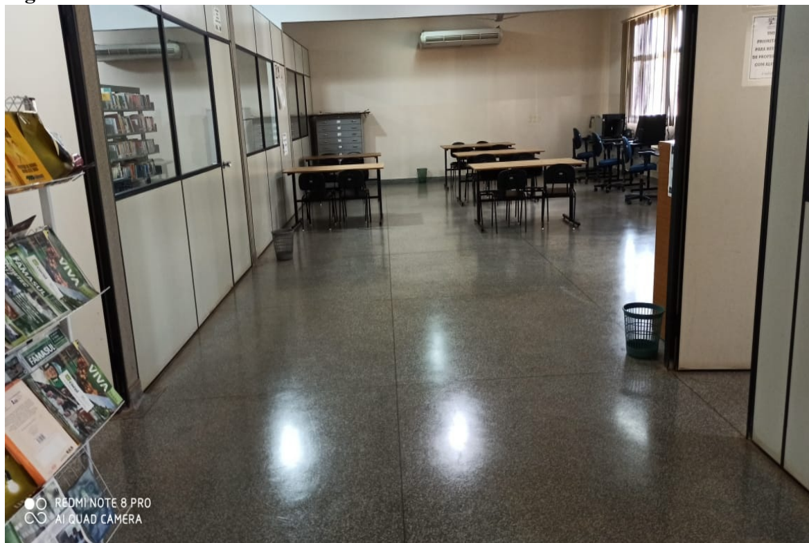
Figura 01 – Sala de estudos da biblioteca UU Glória de Dourados.

Fonte: UU de Glória de Dourados/UEMS, 2020.