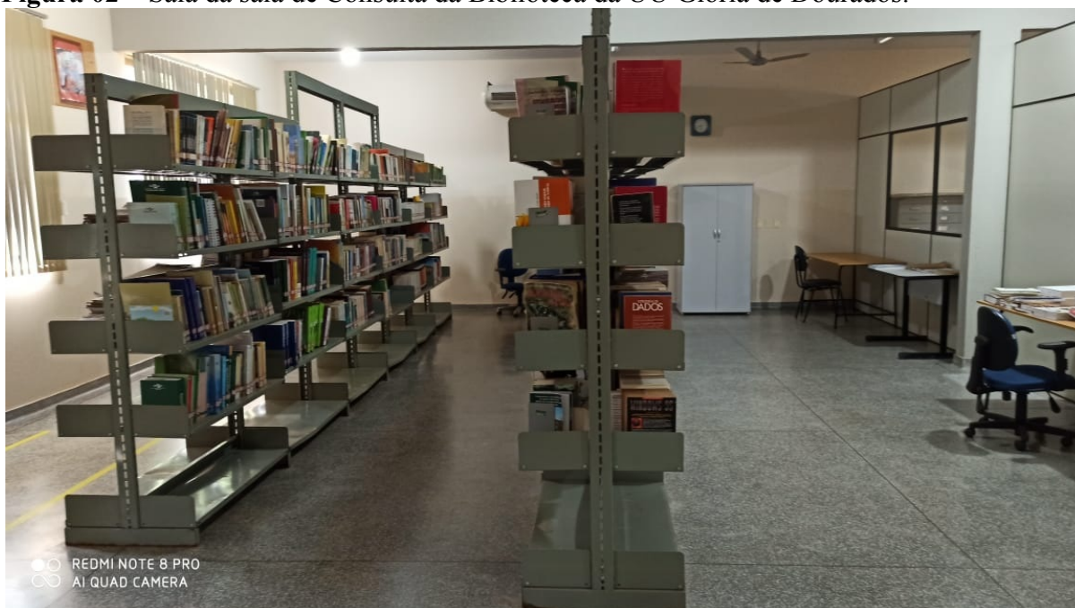
Figura 02 – Sala da sala de Consulta da Biblioteca da UU Glória de Dourados.