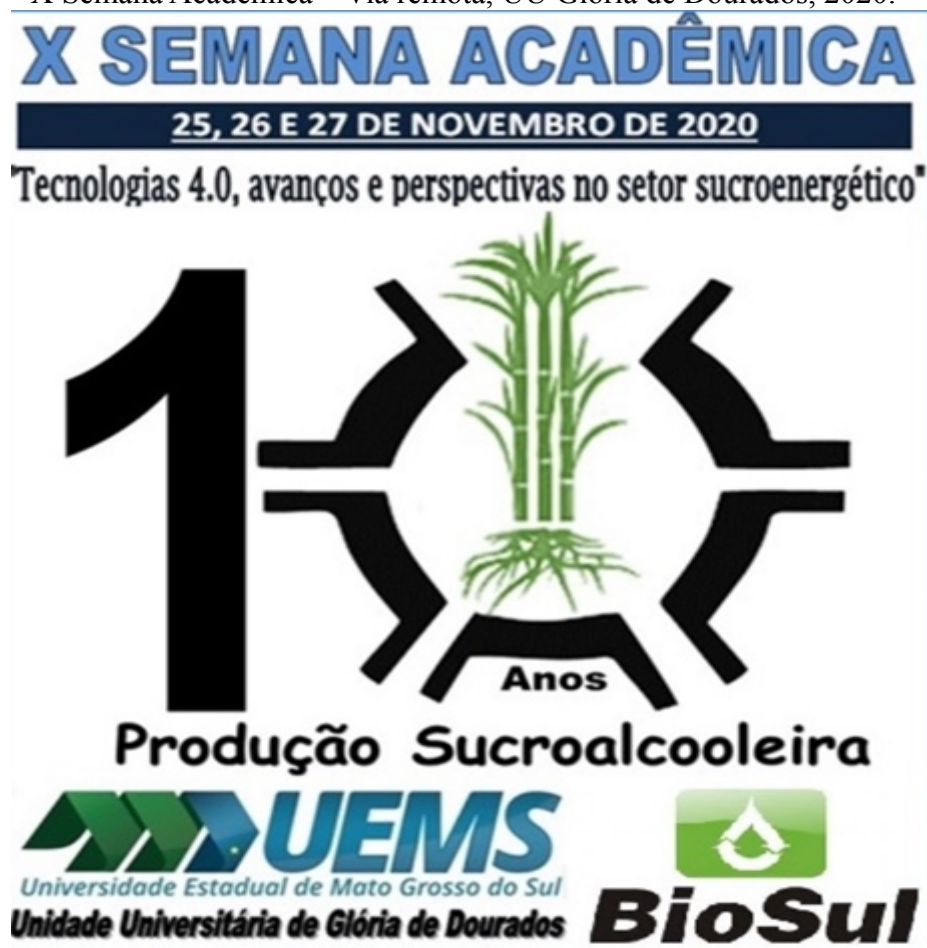
Figura 04 – X Semana Acadêmica – Via remota, UU Glória de Dourados, 2020.