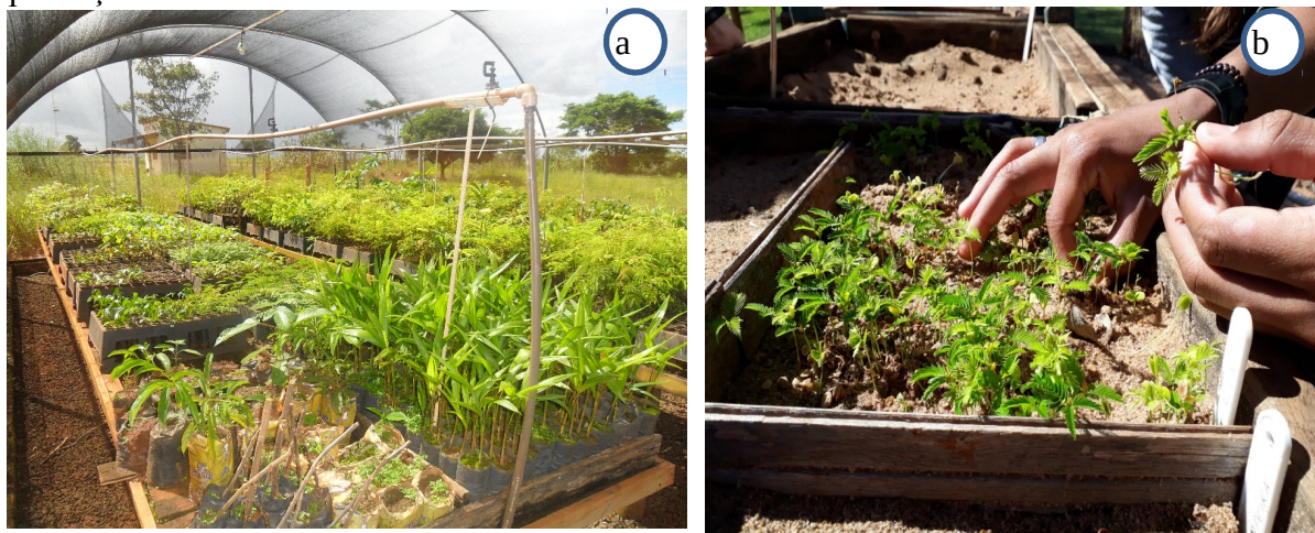
Figura 05 – Cenas de ações de sustentabilidade na UU de Ivinhema. a) viveiro da UU; b) produção de mudas no viveiro

A Unidade tem 02 (dois) professores (titular e suplente) como representantes da IES no Conselho Municipal de Defesa do Meio Ambiente (COMDEMA). Esta vaga existe desde a criação do Conselho, em 2006. A Figura 05 mostra as imagens de ações de sustentabilidade realizadas na UU de Ivinhema.