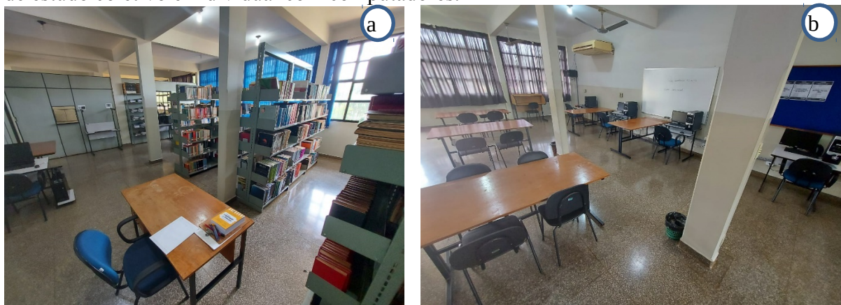
Figura 03 – Ambientes da biblioteca da UU de Ivinhema. a) vista parcial do acervo; b) sala de estudo coletivo e individual com computadores.