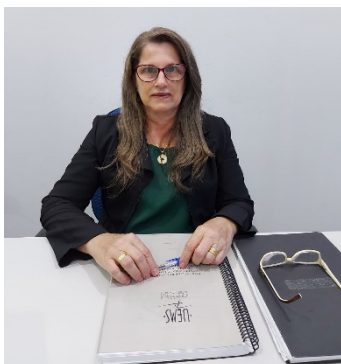
Mensagem da Gerente da Unidade Universitária de Ivinhema

Breve apresentação do relatório de atividades da Unidade Universitária de Ivinhema com as palavras da coordenadora da equipe de elaboração (Gerente da Unidade).