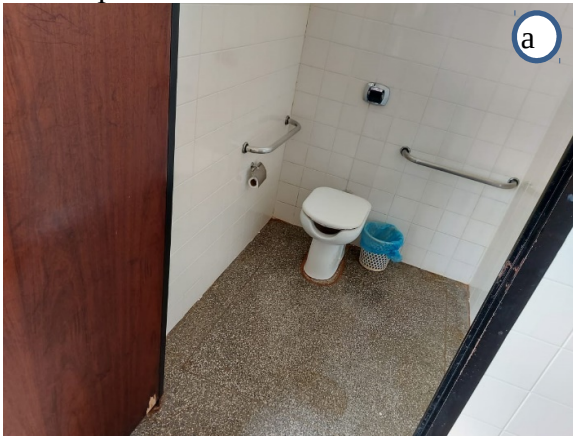
Figura 04 – Cenas dos ambientes de acessibilidade da UU de Ivinhema. a) banheiros adaptados às necessidades especiais; b) câmera digital para projeção da imagem microscópica no computador.

A Unidade ainda não possui piso tátil e não necessita de elevador.