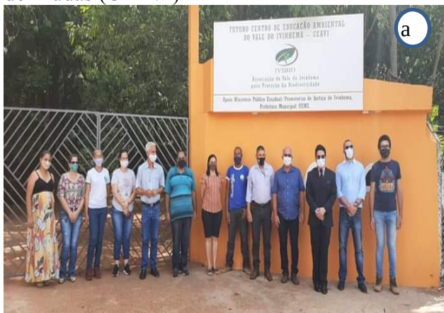
Figura 08 – Destaques da UU de Ivinhema. a) Parceria/Inauguração ONG IVIBIO. b) Viveiro de Mudas (CEAVI)