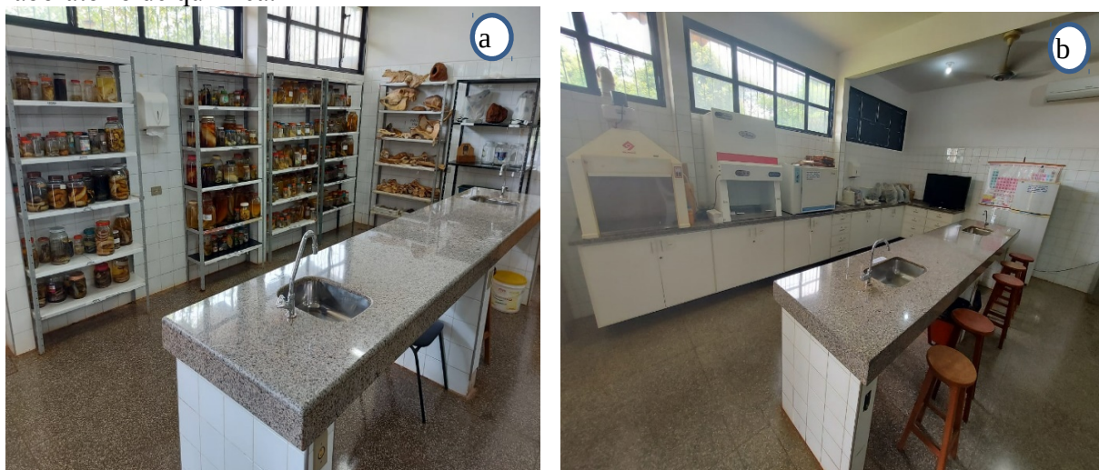
Figura 02 – Fotos dos laboratórios na UU de Ivinhema. a) laboratório de biologia; b) laboratório de química.