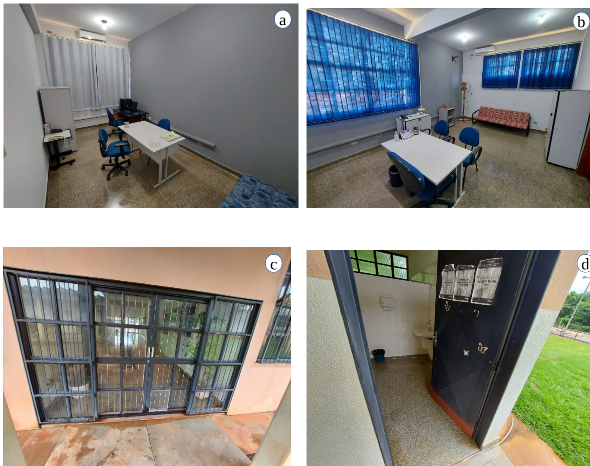
Figura 01 – Imagens das principais alterações/investimentos realizados na UU de Ivinhema. a) Reparos e pintura na sala da coordenação; b) Reparos e pintura na sala da gerência; c) Manutenção e reforma das portas do setor administrativo; d) Manutenção e reparo das portas dos banheiros masculino e feminino.