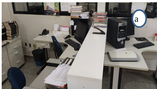
Figura 01 – Ambientes da biblioteca da UU de Paranaíba. a) recepção; b) vista parcial do acervo; c) vista parcial do acervo; d) espaço para estudos.