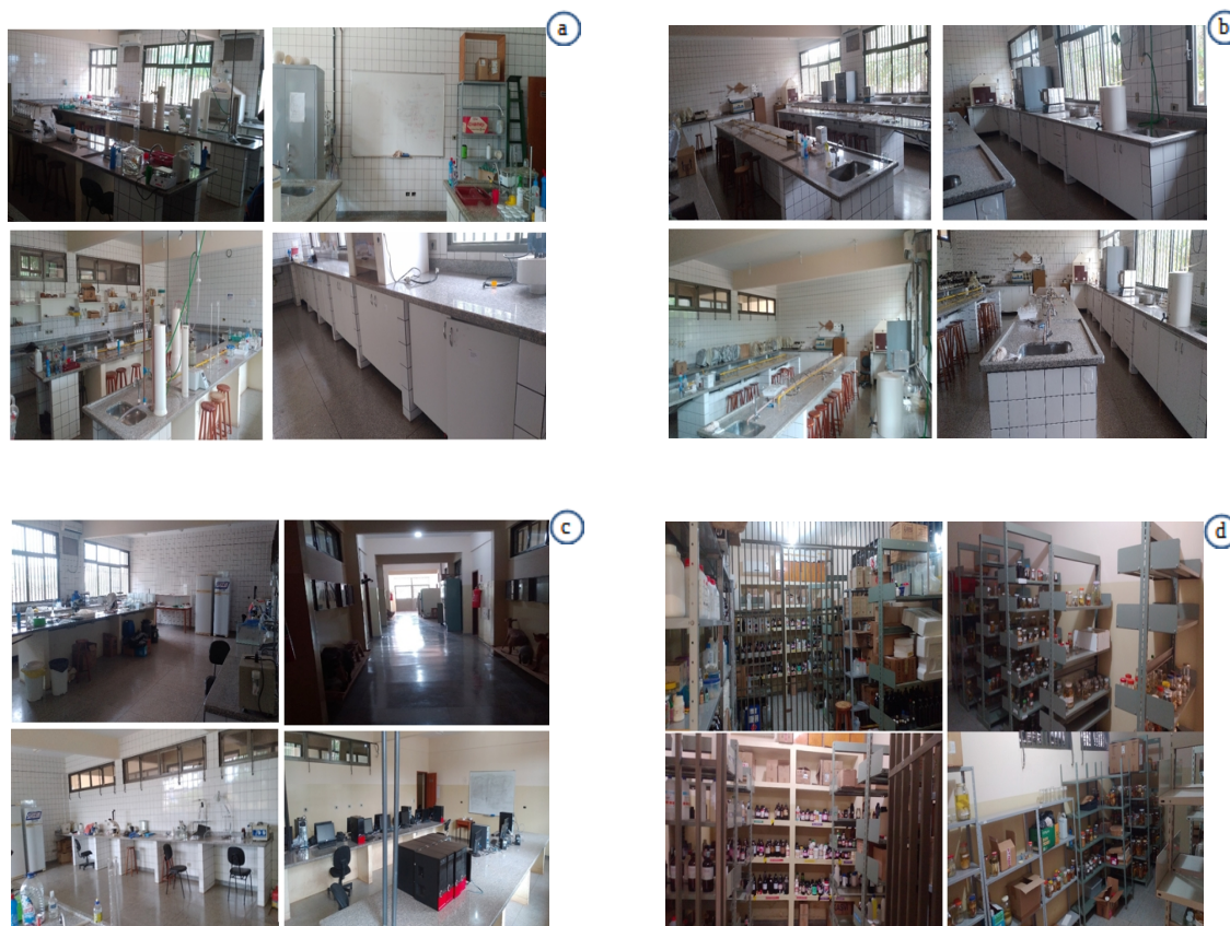
Figura 02 – Laboratórios da UU de Coxim. a) Laboratório de Ensino/Pesquisa de Química com bancada de apoio, armários de vidrarias e utensílios laboratoriais; b) Laboratório de Ensino/Pesquisa de Biologia com bancada de apoio, armários de vidrarias e utensílios laboratoriais; c) Laboratório de Estudos e Pesquisas Biológicas e Laboratório de Informática; d) Depósitos de materiais/reagentes químicos e Depósitos de equipamentos, materiais de pesquisa e coleções científicas.