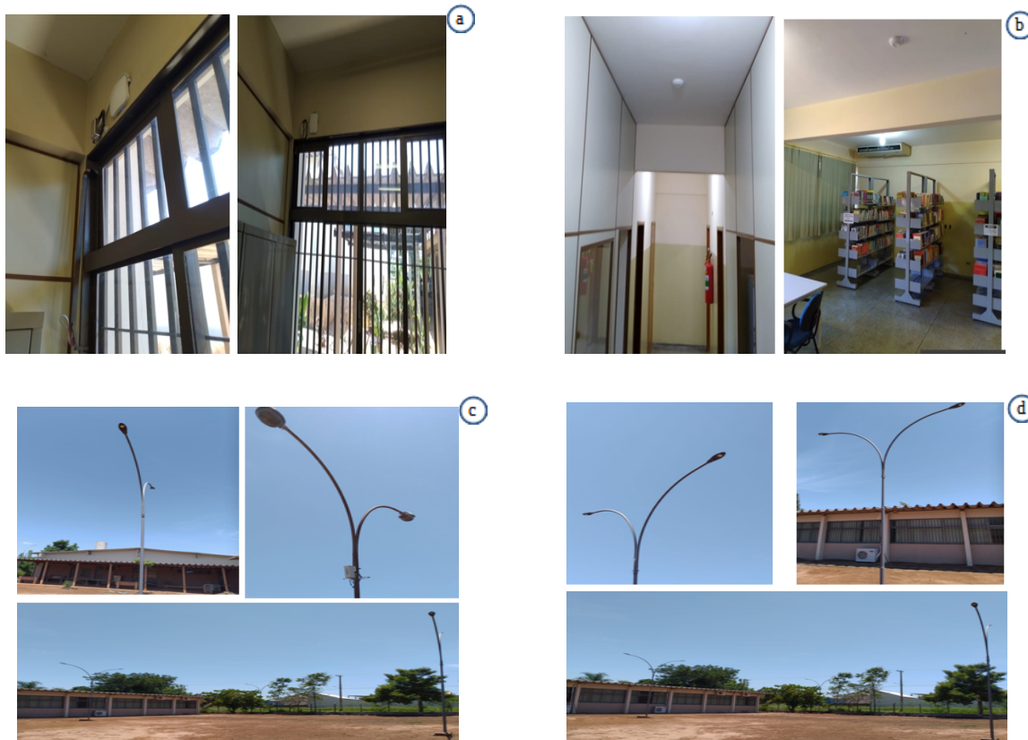
Figura 01 – Imagens das principais alterações/investimentos realizados na UU de Coxim. a) Instalação da Infraestrutura de rede wi-fi na área administrativa; b) Infraestrutura de rede wi-fi no corredor do Bloco I e na Biblioteca; c) Reparo na iluminação externa no pátio da UU; d) Reparo na iluminação externa.