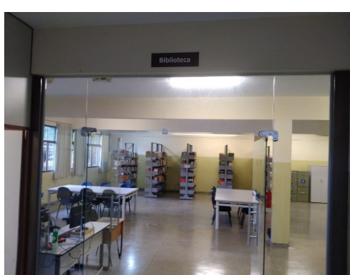
Figura 03 – Ambientes da Biblioteca da UU de Coxim. a) Recepção; b) Ambiente de estudo individual e coletivo; c) vista parcial do acervo; d) Espaço destinado ao estudo individual.