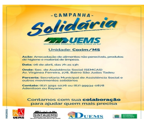
Figura 06 – Principal ação/evento realizado na UU de Coxim em 2020. a) Material para divulgação da Campanha Solidária; b) Cestas Básicas que foram doadas ao CRAS; c) Os Técnicos – Administrativos realizando a entrega das cestas Básicas; d) Acadêmica recebendo o donativo.