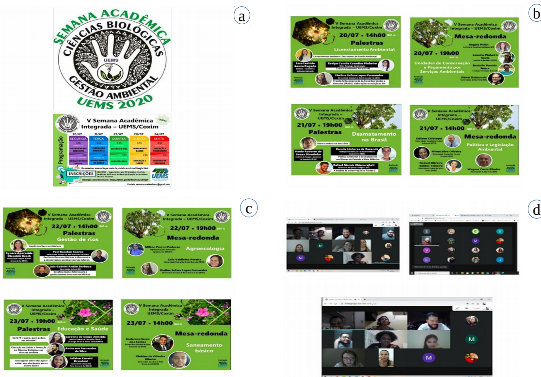
Figura 07 – Principal ação/eventos que contou com a presença de representantes da UEMS da UU de Coxim. a) Banner para divulgação da V Semana Acadêmica e a sua programação; b) Divulgação das palestras e mesa-redonda referente aos primeiros dias do evento; c) Divulgação das palestras e mesa-redonda referente aos dias subsequentes ao início do evento; d) Divulgação das palestras e mesa-redonda referente ao último dia do evento e alguns print's do encontro virtual.

Os cursos de Ciências Biológicas e Gestão Ambiental da UU de Coxim promoveram, de 20 a 24 de julho, a V Semana Acadêmica Integrada, destinada aos acadêmicos da área ambiental, englobando os cursos como Engenharia Ambiental, Gestão Ambiental e Ciências Biológicas. Seguindo as recomendações do Protocolo de Biossegurança da UEMS para esse momento de Pandemia, a Semana Acadêmica foi realizada de forma online , por meio de videoconferência, com os encontros transmitidos pela plataforma Google Meet . Foram realizadas 162 inscrições e permaneceram cerca de 80 a 100 alunos por períodos.