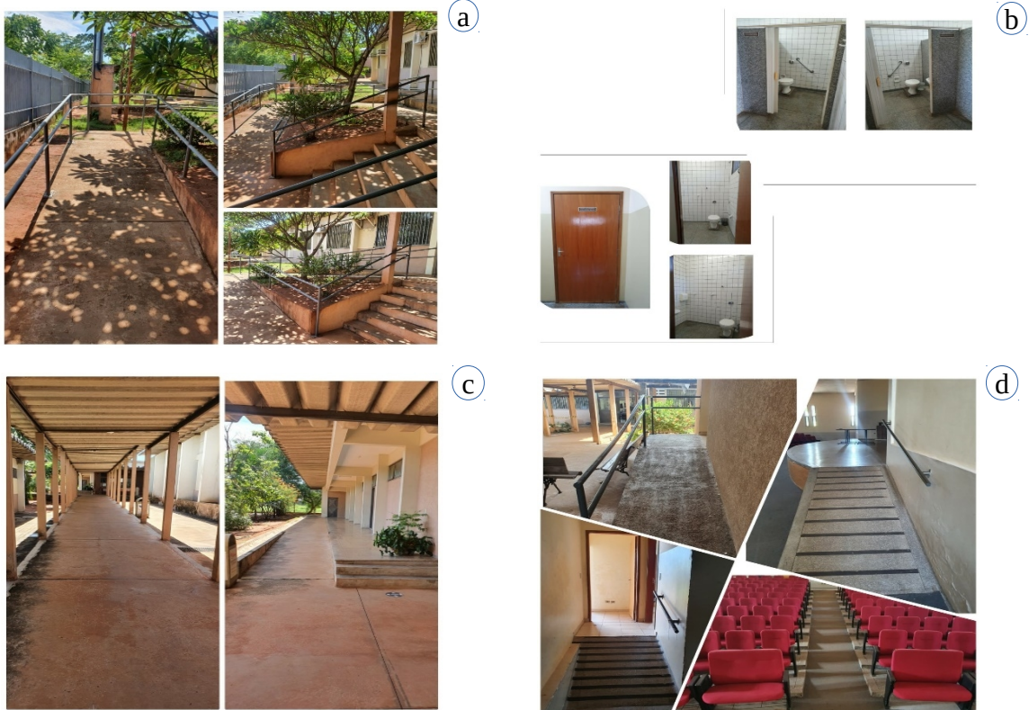
Figura 04 – Cenas dos ambientes e instrumentos de acessibilidade da UU de Coxim. a) Rampa de acesso à administração; b) Banheiros femininos e masculinos destinados aos acadêmicos e banheiro adaptado na área administrativa; c) Rampa de acesso às salas de aula; d) Rampas e barras de apoio lateral que dão acesso ao auditório, além das cadeiras adaptadas para pessoas obesas e cadeirantes.

sanitário para facilitar o acesso de deficientes; o bebedouro é de fácil acesso e acessível a todo usuários; existem corrimãos nas rampas e nas escadarias com barras de apoio; e, há sinalização referencial do espaço e repartições como, salas, biblioteca, banheiro, laboratório entre outros.