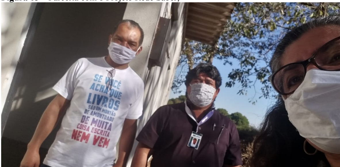
Figura 03 – Parceria com o Projeto Rede Saber;