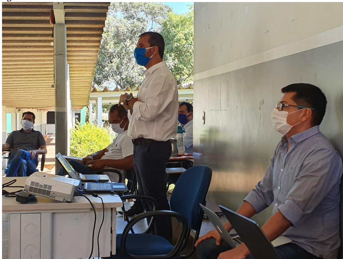
Figura 07 – Reunião com Reitoria.