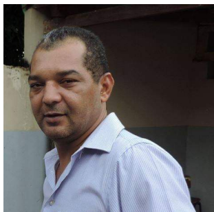
Mensagem do gerente da Unidade Universitária de Jardim

Com mais de duas décadas de existência, a Unidade Universitária de Jardim é uma instituição ainda jovem, bem como a Universidade Estadual de Mato Grosso do Sul mas, assim como muitos dos jovens que ingressaram e ingressam em nossos cursos de graduação todos os anos, precisou amadurecer, buscar novos desafios, impor-se e tornar-se o que é hoje: referência na educação sul mato grossense e, em especial, nesta região sudoeste desse estado. Há mais de 20 (vinte) anos estamos construindo a