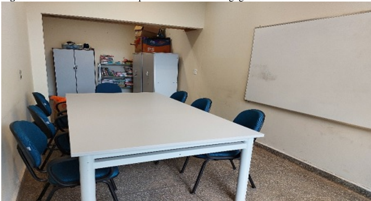
Figura 05 – Laboratório Interdisciplinar de Práticas Pedagógicas

O Laboratório Interdisciplinar de Práticas Pedagógicas se constitui num ambiente de estudos e organização de material para aulas e ou eventos. Não possui computadores nem impressora, apenas materiais para confecções de aulas. Fica disponibilizado para os acadêmicos de ambos os cursos com prévia solicitação.