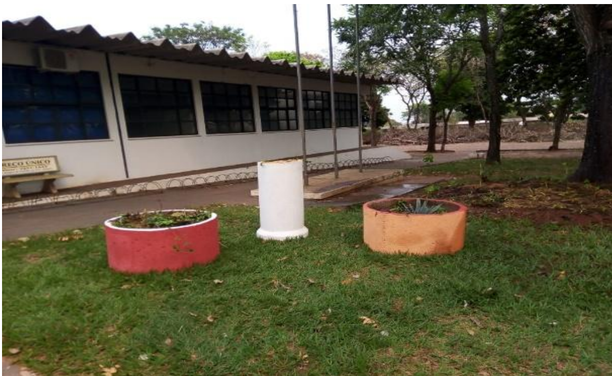
Figura 01 – projeto de Jardinagem realizado pela Gerência.