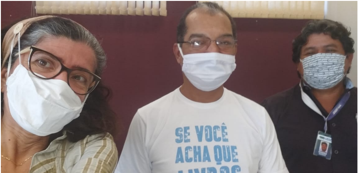
Figura 08 – Visita do Coordenador do Projeto Rede Saber.