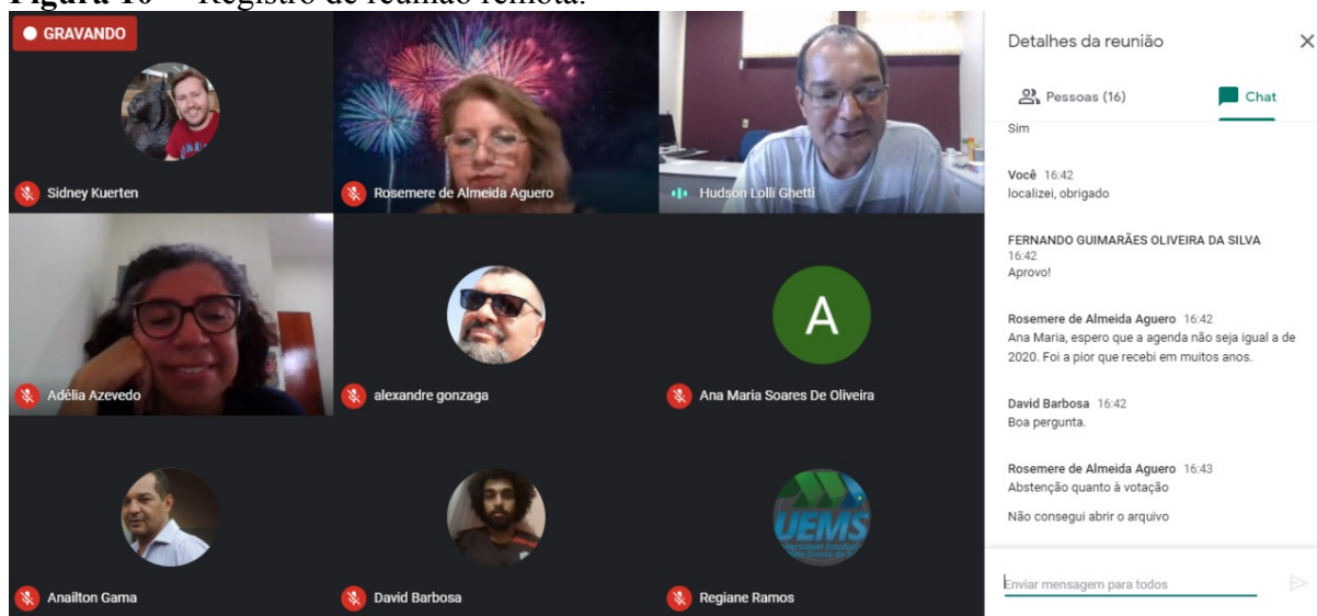
Figura 10 – Registro de reunião remota.