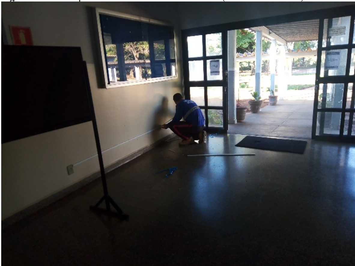
Figura 04 – Reparo em toda a rede elétrica (interna e externa) da Unidade.