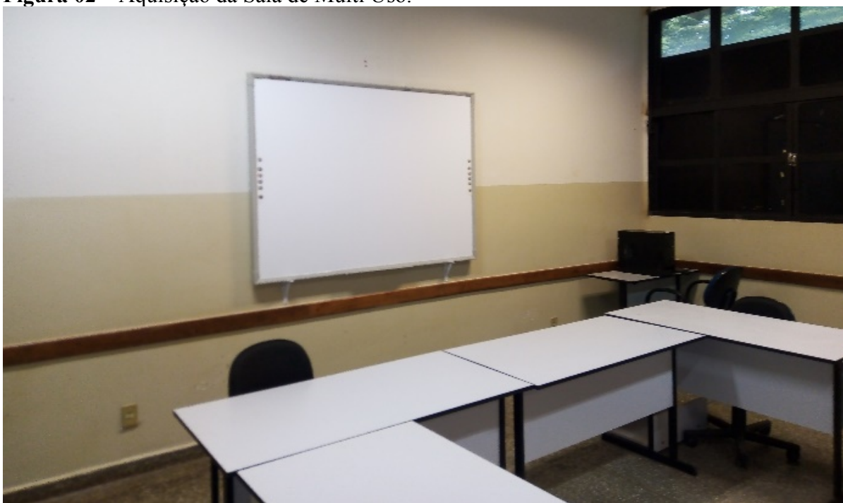
Figura 02 – Aquisição da Sala de Multi Uso.