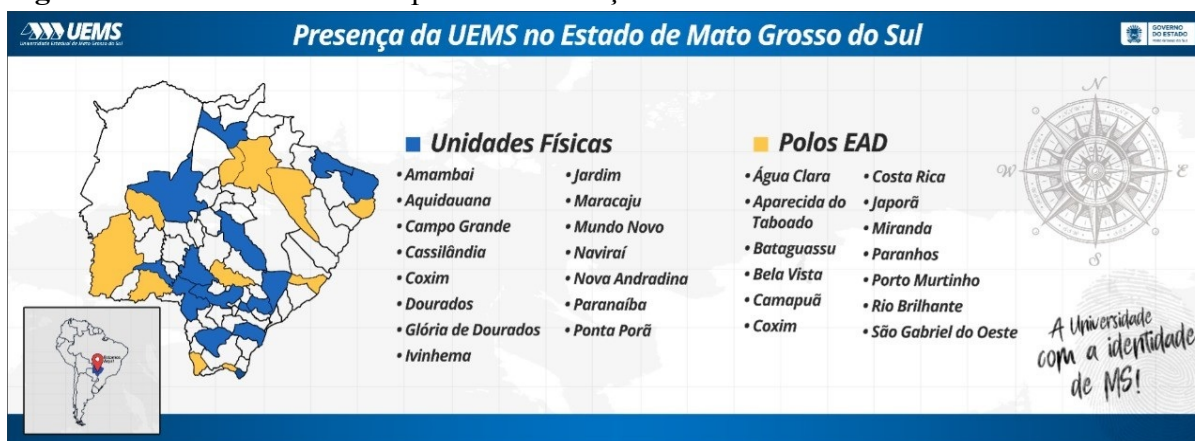
Figura 02 – Unidades físicas e polos de Educação a Distância da UEMS.