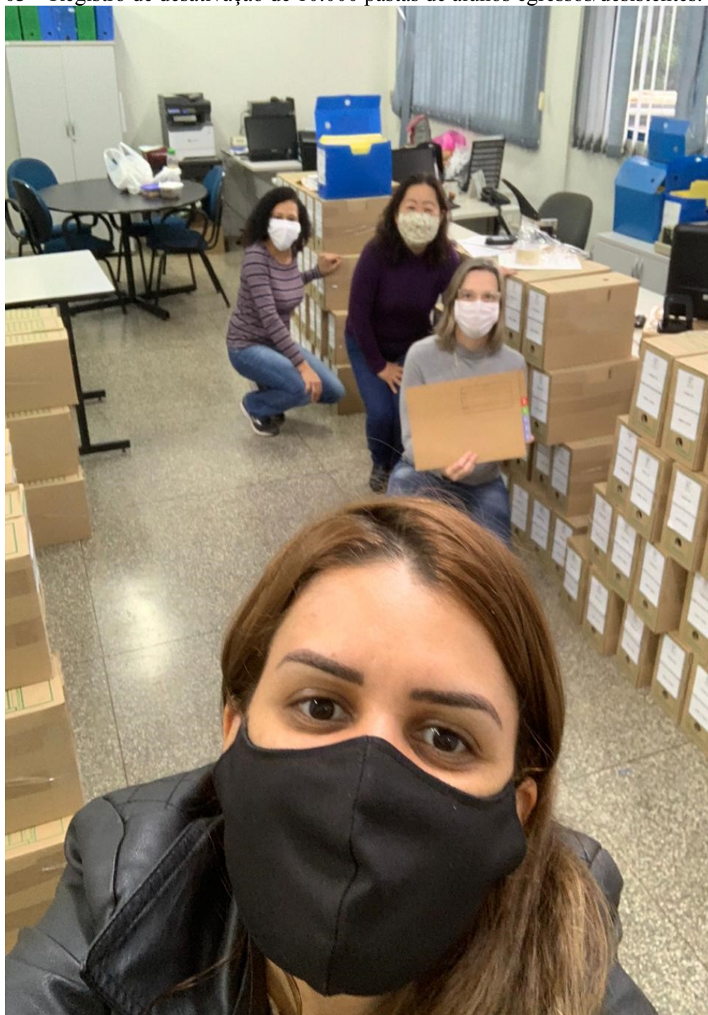
Figura 03 – Registro de desativação de 10.000 pastas de alunos egressos/desistentes.