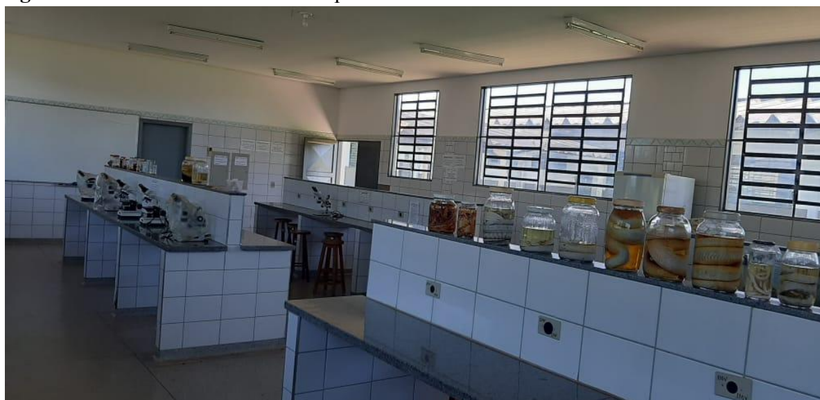
Figura 03 – Laboratório de Microscopia de Cassilândia.