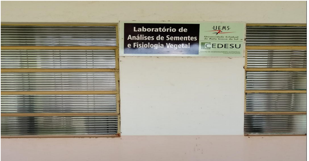
Figura 08 – Laboratório de Sementes.