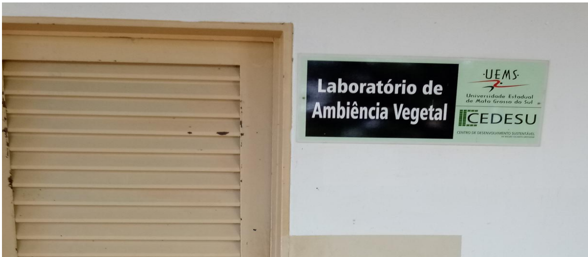
Figura 07 – Laboratório Ambiente Vegetal de Cassilândia.