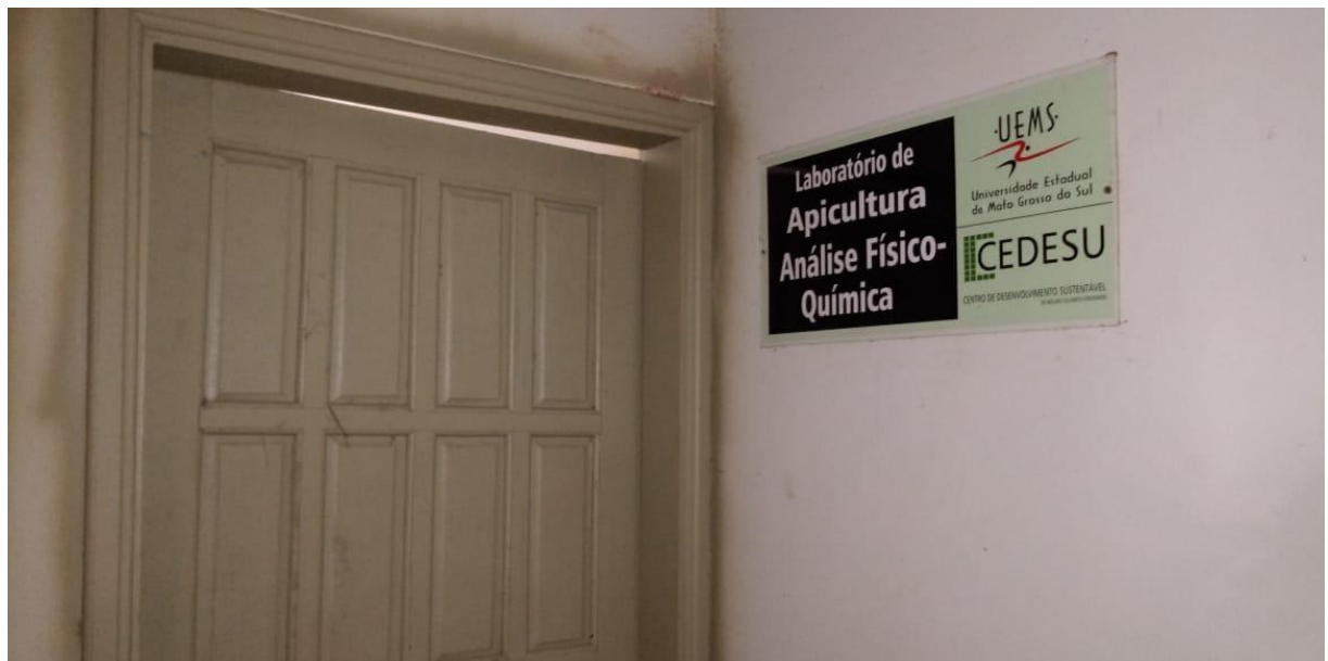
Figura 09 – Laboratório de Apicultura.