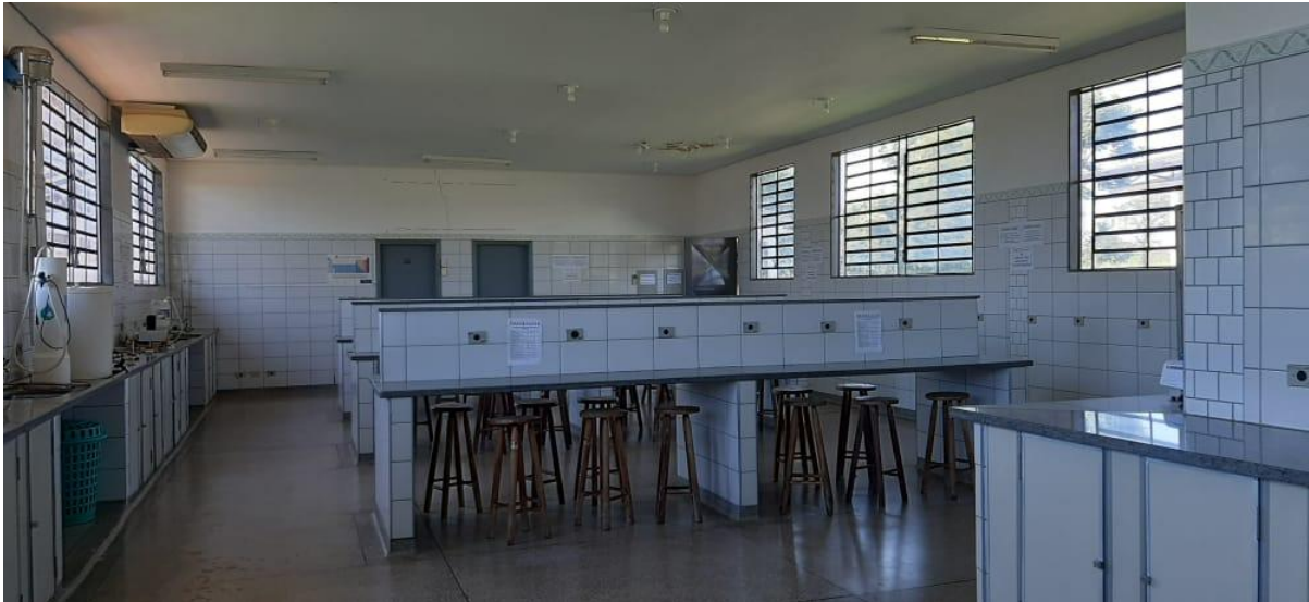
Figura 06 – Laboratório de Química.