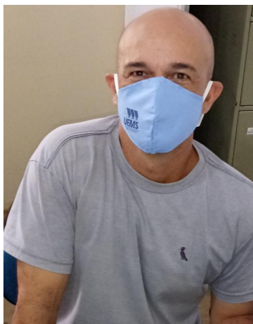
Mensagem do Gerente da Unidade Universitária de Cassilândia

“Somos arquitetos do nosso próprio destino”. Albert Einstein