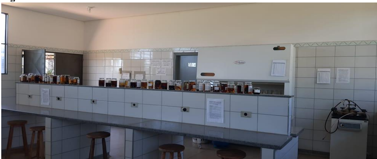
Figura 04 – Laboratório de Fitossanidade de Cassilândia.