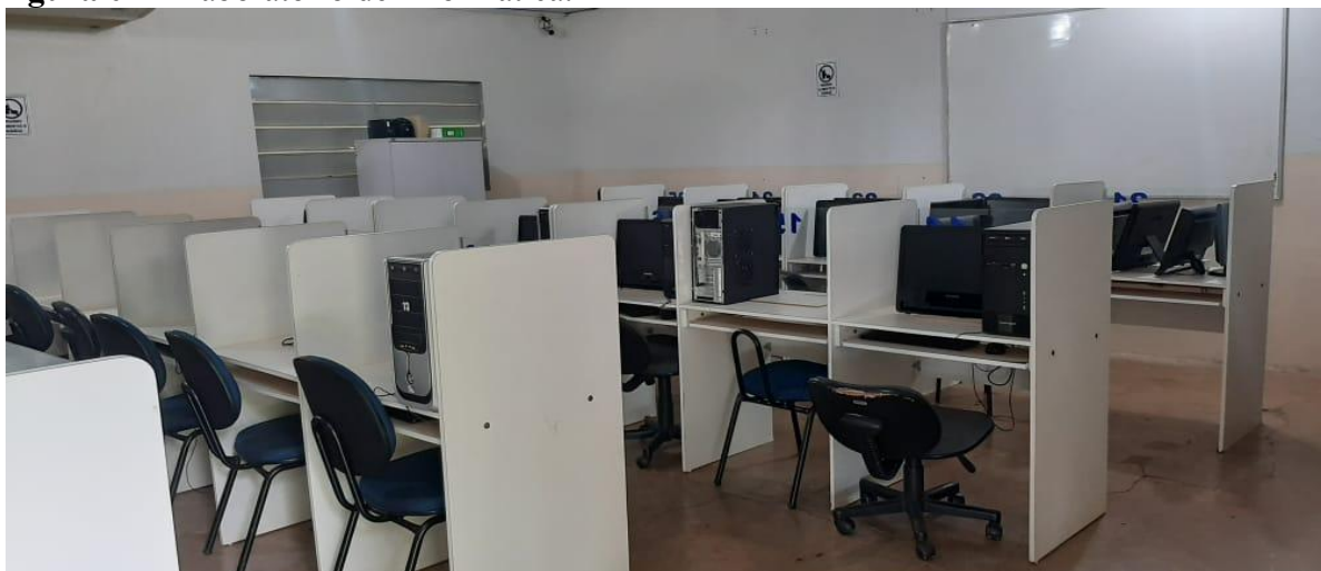
Figura 01 – Laboratório de Informática.

Qtd.*= Quantidade, Equip.*= Equipamentos