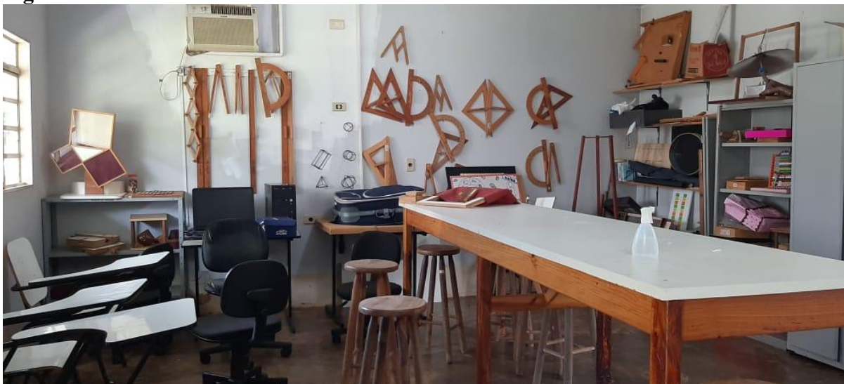
Figura 02 – Laboratórios de Matemática.