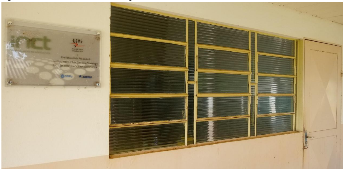
Figura 10 – Laboratório Entomologia.