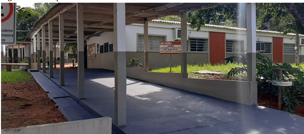
Figura 13 – Rampa de acesso Culturas de Cassilândia.

A UU de Cassilândia está apta a receber alunos com deficiência motora, pois está equipada com rampas de acesso para cadeirantes (Figura 14 a) e banheiros adaptados (Figura 15 a) e b).