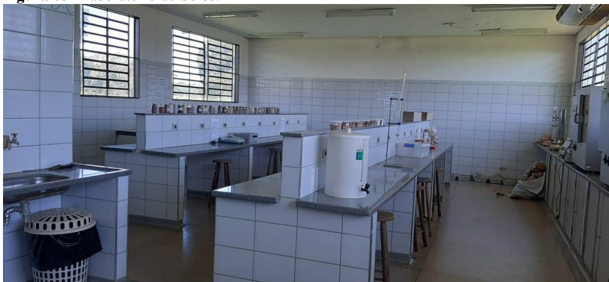
Figura 05 – laboratório de Solos.