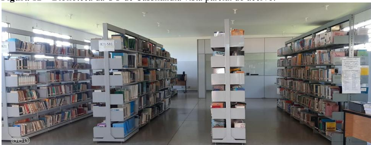
Figura 12 – Biblioteca da UU de Cassilândia vista parcial do acervo.