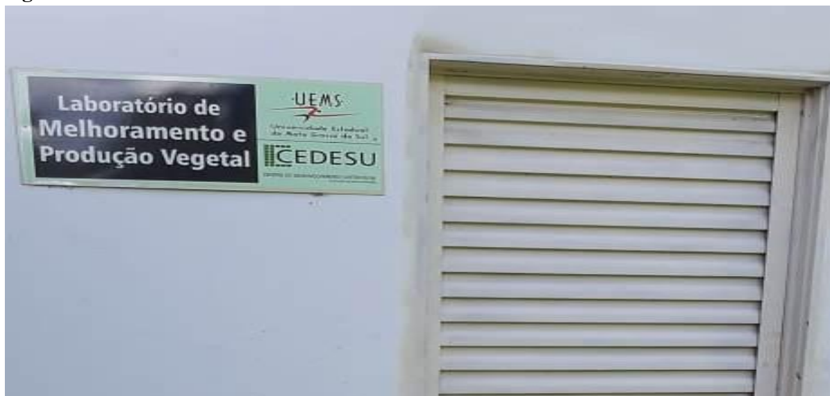
Figura 11 – Laboratório de Grandes Culturas.