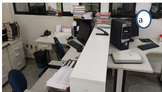
Figura 01 – Ambientes da biblioteca da UU de Paranaíba. a) recepção; b) vista parcial do acervo; c) vista parcial do acervo; d) espaço para estudos.