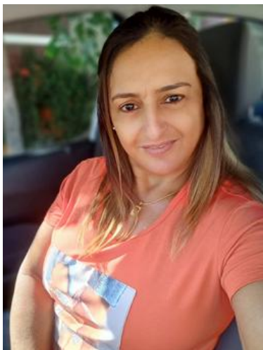
Mensagem da Gerente da Unidade Universitária de Paranaíba

A Universidade Estadual de Mato Grosso do Sul, a nossa UEMS, que tem uma desafiadora missão: Gerar e disseminar o conhecimento, com vistas ao desenvolvimento das potencialidades humanas, dos aspectos político, econômico e social do Estado, e com compromisso democrático de acesso à educação superior e o fortalecimento de outros níveis de