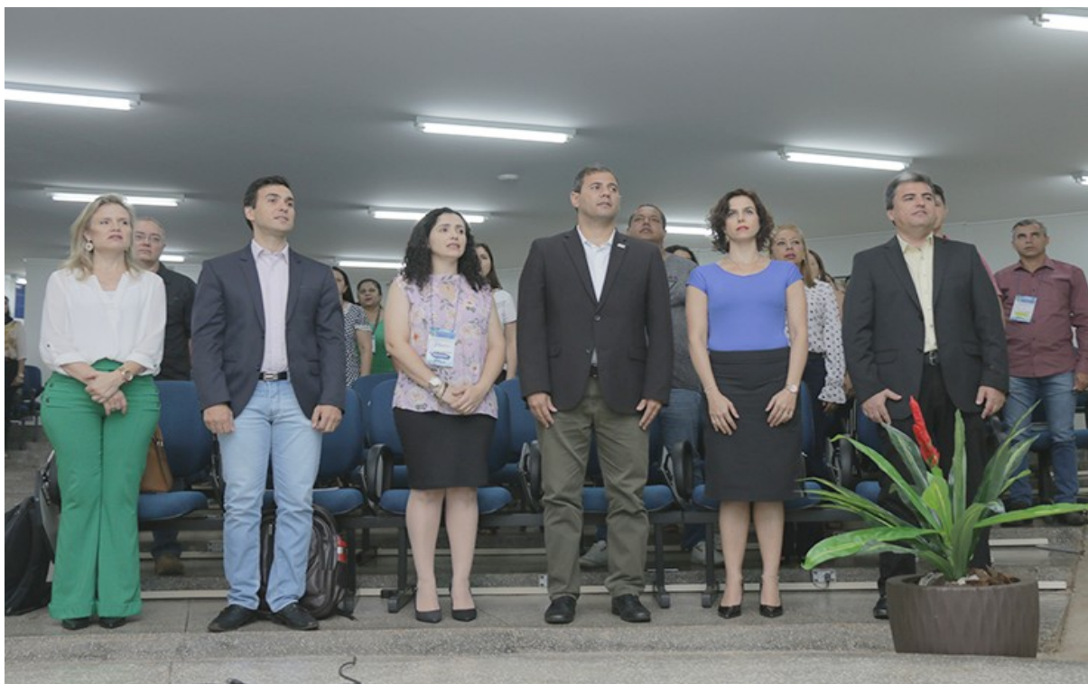
Imagem 2. Abertura do evento – UEMS/2018.