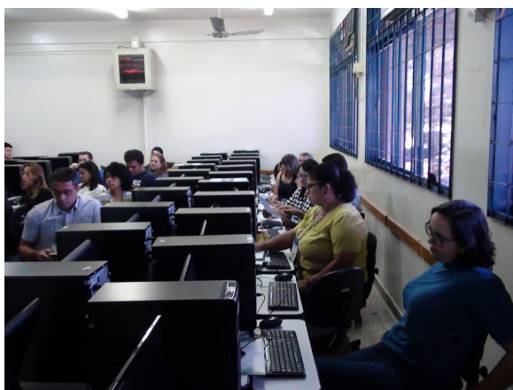
Imagem 3. Oficina Ferramenta de Criação de VídeoAula para EaD: You Tube – UEMS/2018.

No total foram realizadas cinco oficinas, duas palestras, uma roda de debate com pesquisadores da área, uma reunião entre os coordenadores de polos UABMS, DED/UEMS, EaD/UFMGD e EaD/IFMS e a reunião do Fórum dos Coordenadores UAB/MS.