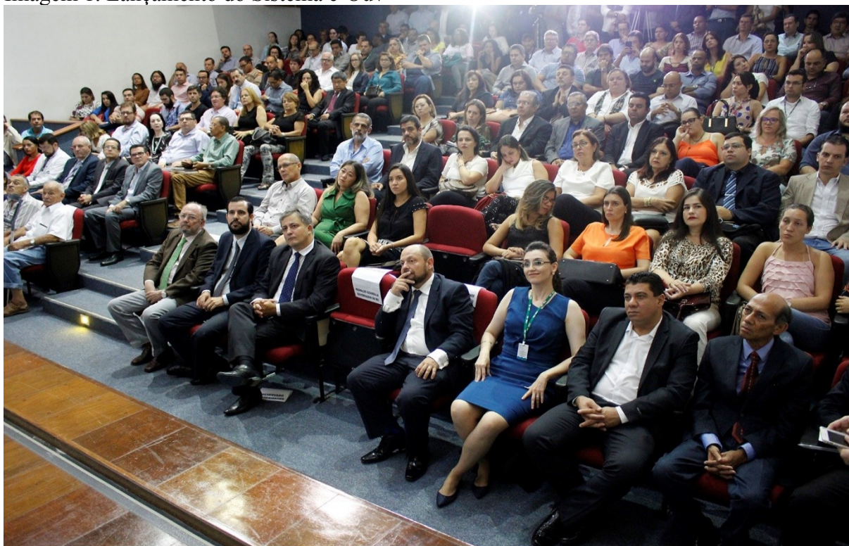
Imagem 1. Lançamento do Sistema e-Ouv