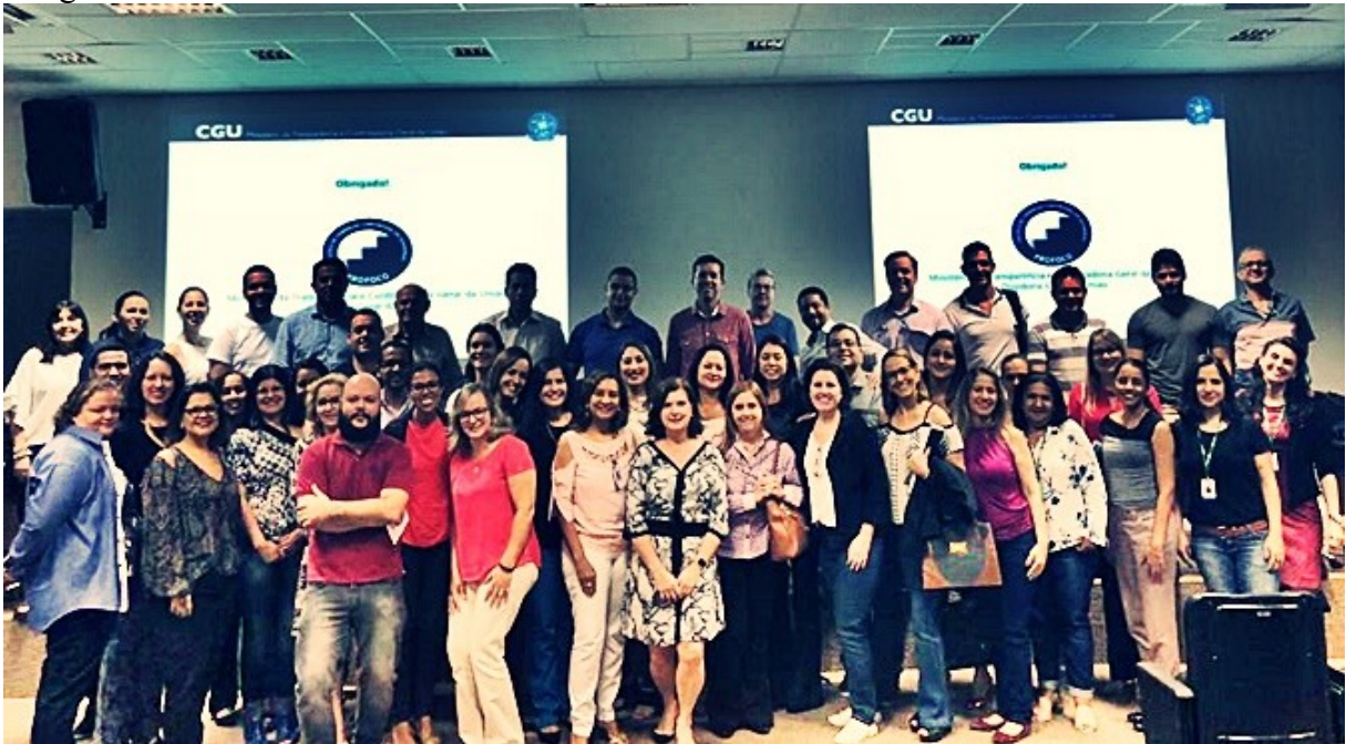
Imagem 2. Turma do Curso Tratamento de Denúncias em Ouvidoria