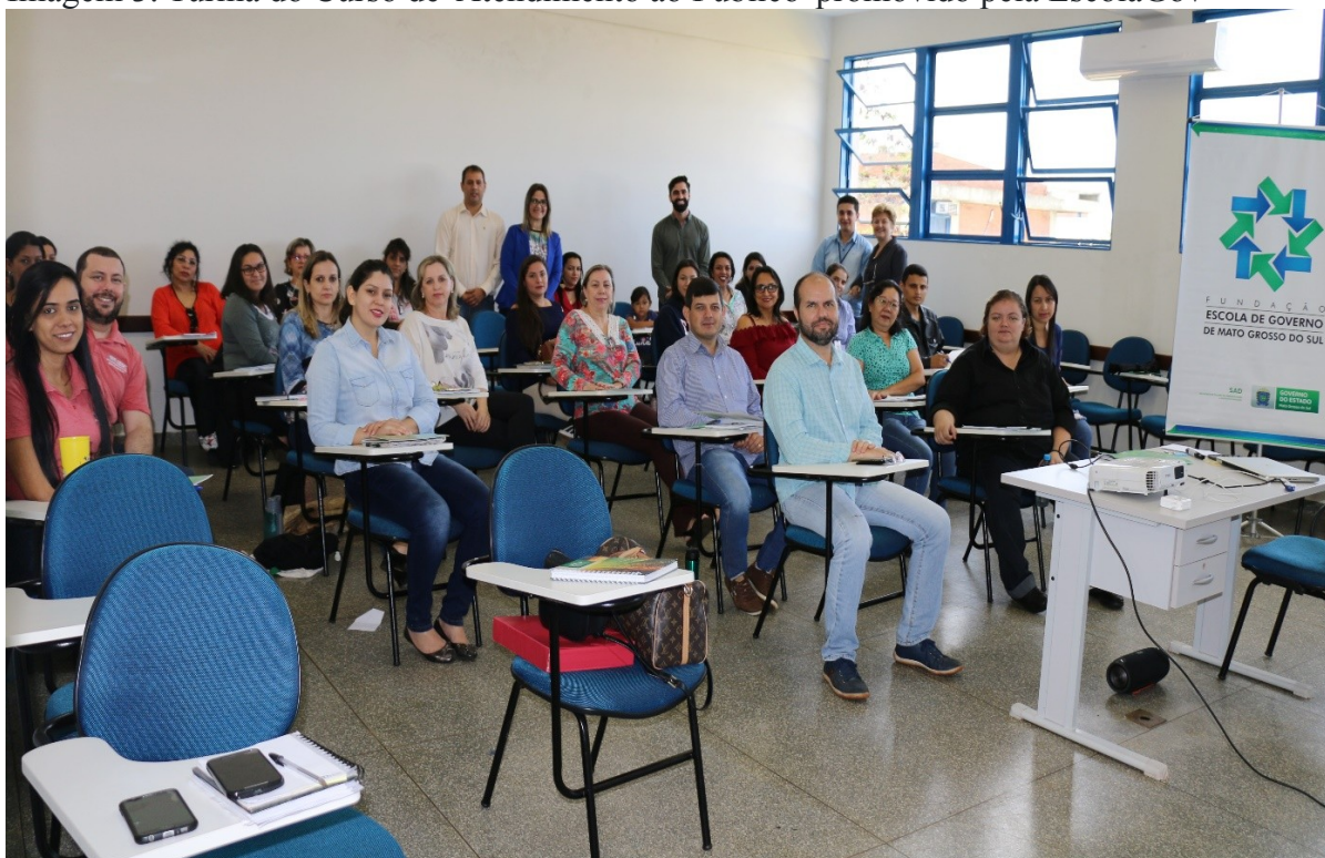
Imagem 3. Turma do Curso de 'Atendimento ao Público' promovido pela EscolaGov