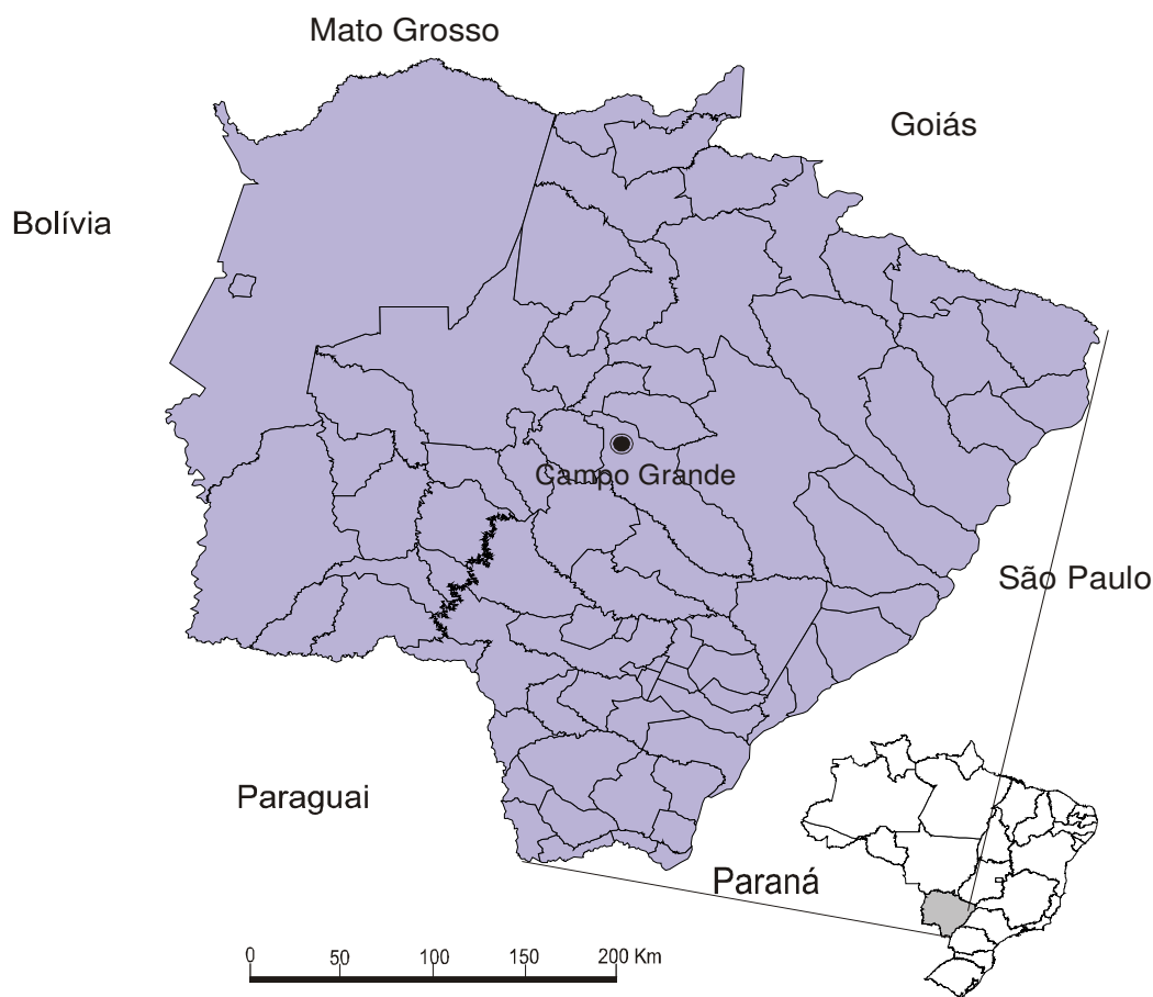
Figura 1 – Mapa do estado de Mato Grosso do Sul com destaque para os municípios abrangidos pela pesquisa