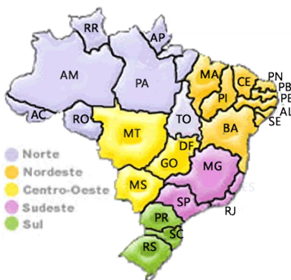
Figura 1. Mapa dos estados brasileiros, com destaque para Mato Grosso do Sul e seus estados limítrofes: Paraná, São Paulo, Minas Gerais, Goiás e Mato Grosso.

O estado de Mato Grosso do Sul é composto por 79 municípios. No estado há predomínio de clima subtropical, tropical de altitude e tropical, seus municípios apresentam durante o ano temperaturas médias em torno 25°C. O estado está no Fuso horário UTC-04:00 e possui limites geográficos com cinco estados brasileiros (Figura 1): Mato Grosso, Goiás, Minas Gerais, São Paulo e Paraná.