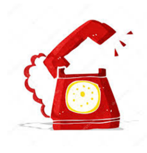
Figura 7. Formas de realizar ligações locais, nacionais e internacionais.

Para chamadas internacionais, também se pode comprar um cartão de ligação internacional. Você paga o valor do cartão e ele dá minutos para ligar para o país. Você tem que ver qual cartão dá mais minutos para seu país. Este cartão pode ser comprado em lan houses.