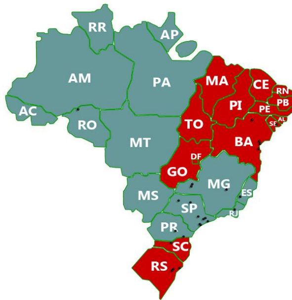
Figura 5. Voltagens existentes no Brasil, em azul estados com voltagens 110V e em vermelho estados com voltagem 220V.