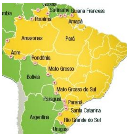
Figura 2. Brasil e os países vizinhos, com destaque para Mato Grosso do Sul e sua divisa com Paraguai e Bolívia.

Além disso, Mato Grosso do Sul faz divisa com dois países, Paraguai e Bolívia (Figura 2). Essa proximidade com outros países permite o desenvolvimento de uma rota comercial via Oceano Pacífico, a Rota de Integração Latino Americana ou Rota Bioceânica, que faz de Mato Grosso do Sul o principal ponto de um novo eixo de comercialização.