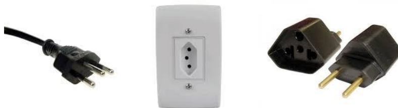
Figura 6. Tipo de tomada usada no Brasil.

Desde 1º de janeiro de 2010, o NBR 14136 é o padrão oficial de toma-as no Brasil. A venda de outros tipos de tomada é proibida pelo INMETRO desde esta data. O padrão foi escolhido por ser mais seguro e por contar com o condutor terra. Há o modelo apropriado para aparelhos que necessitem de corrente até 10A e até 20A, funcionando no segundo modelo, ambos os tipos de aparelhos (Figura 6).