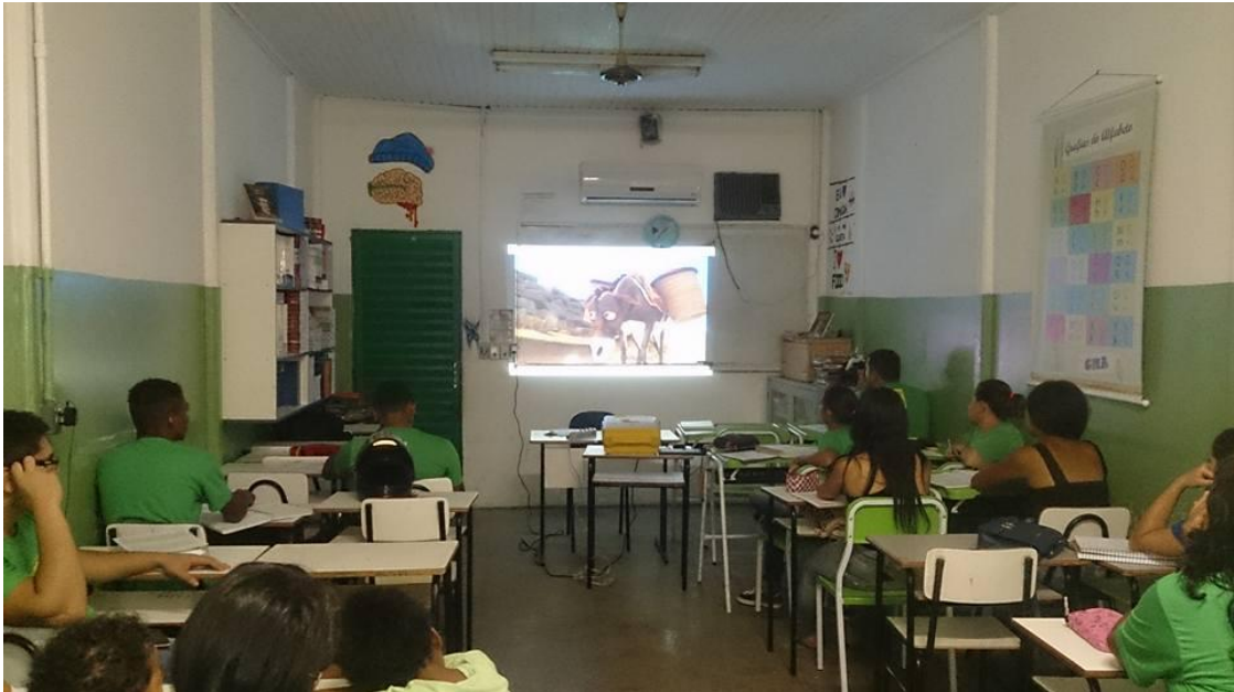
FIGURA 2- SALA 6