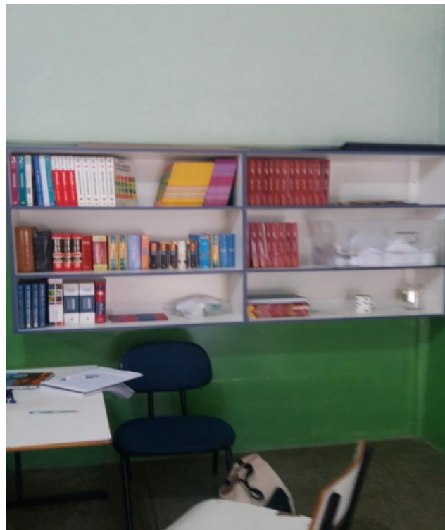
FIGURA 4- ESTANTE DE LIVROS