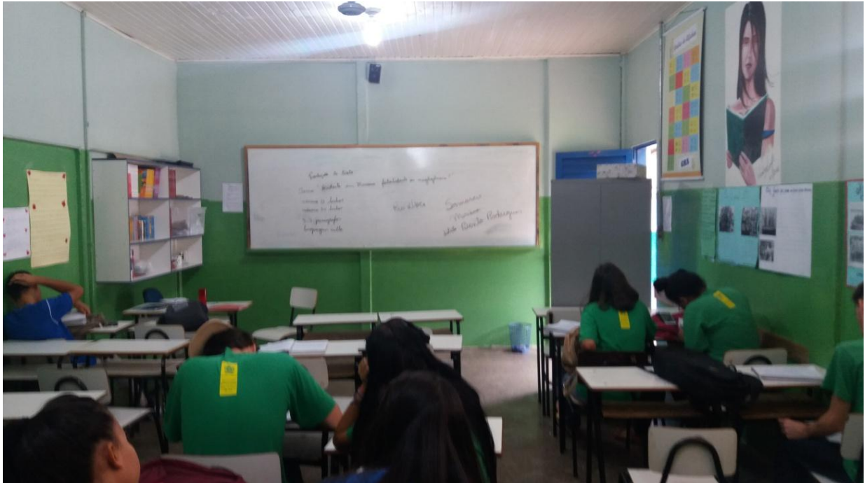
FIGURA 1- SALA 5