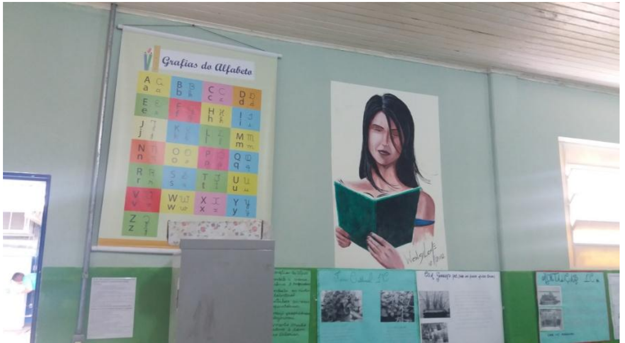
FIGURA 5 – PAREDE SALA 6