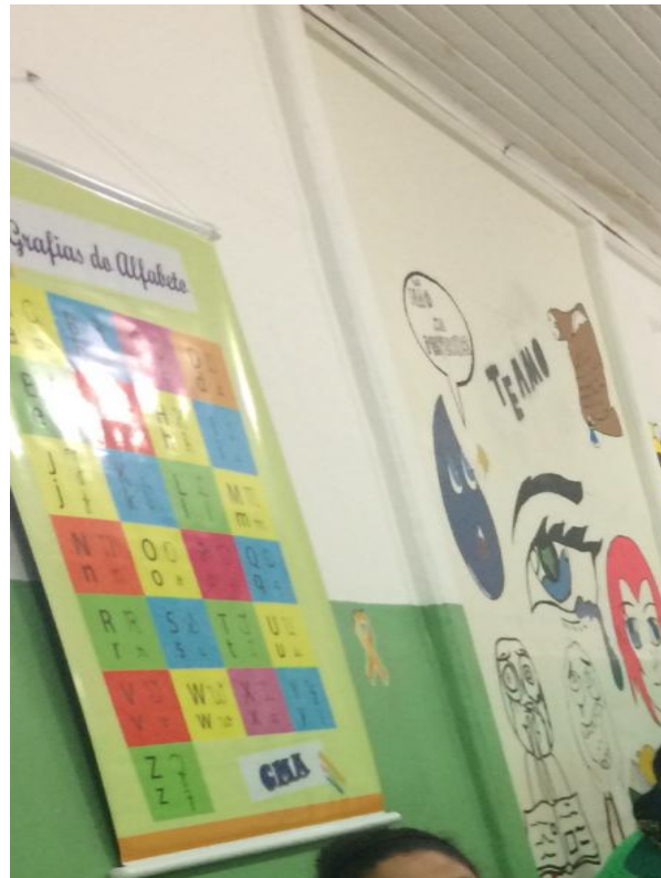
FIGURA 7- PAREDE SALA 6

Fonte: Fotografia do acervo pessoal da pesquisadora.