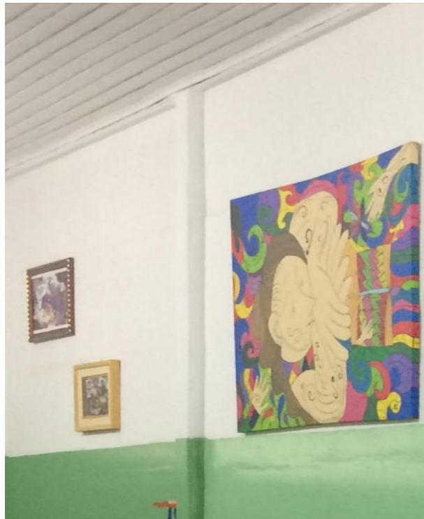
FIGURA 8- PAREDE SALA 6