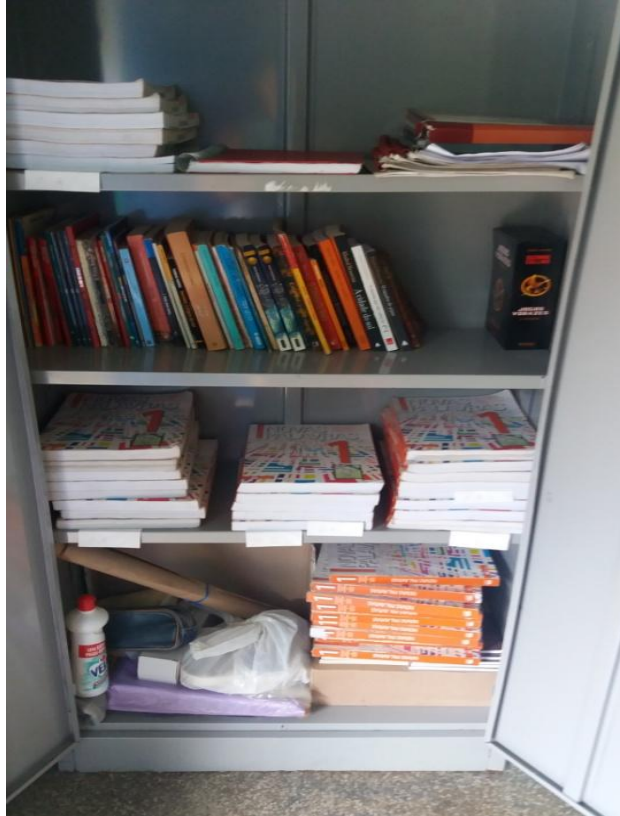
FIGURA 3- ARMÁRIO DE LIVROS