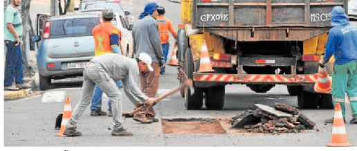
MANUTENÇÃO. Operação tapa-buraco não dá conta dos reparos necessários

O reflexo do corte de investimentos em tapa-buraco está explícito nas ruas: crateras por todos os bairros. A gestão de Alcides Bernal reduziu em 85% os investimentos desde agosto do ano passado. Consultor explica que quantia é insuficiente. PÁGINA 8