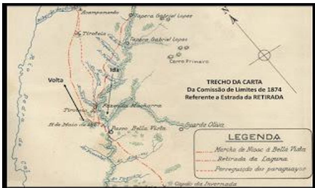
Figura 1: Trajeto percorrido pela coluna da Retirada da Laguna