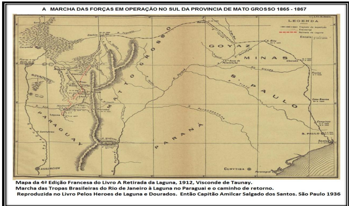
Figura 1: Trajeto das Forças Expedicionárias da Retirada da Laguna.