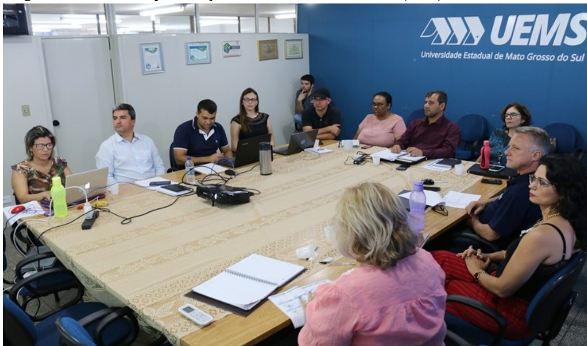
Imagem 2: Reunião de apresentação do Sistema de Bibliotecas (SGB) - 2018.