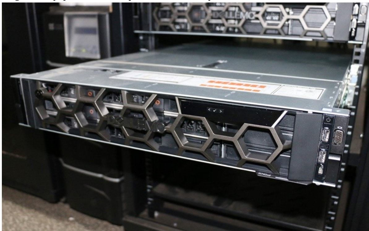
Imagem 1: Equipamento de computador servidor adquirido no ano de 2018.