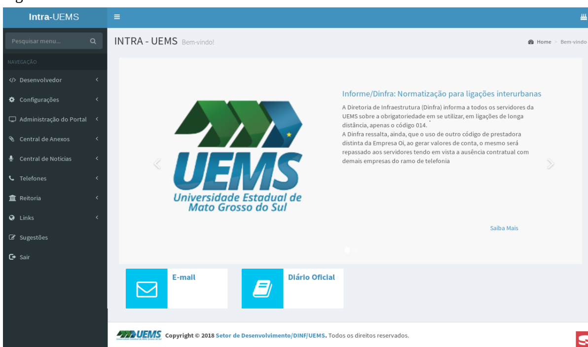
Figura 1: Nova Intra-UEMS – 2018.