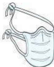
Máscara Cirúrgica (paciente durante o transporte)