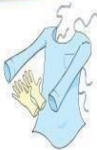
Luvas e Avental