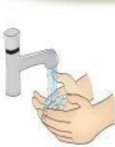
Higienização das mãos

Devem ser seguidas para TODOS OS PACIENTES , independente da suspeita ou não de infecções.