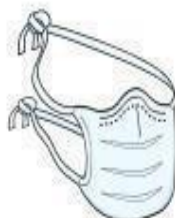
Máscara Cirúrgica (paciente durante o transporte)