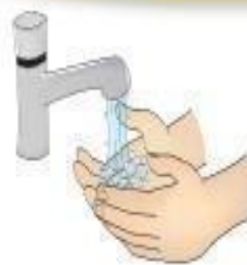
Higienização das mãos