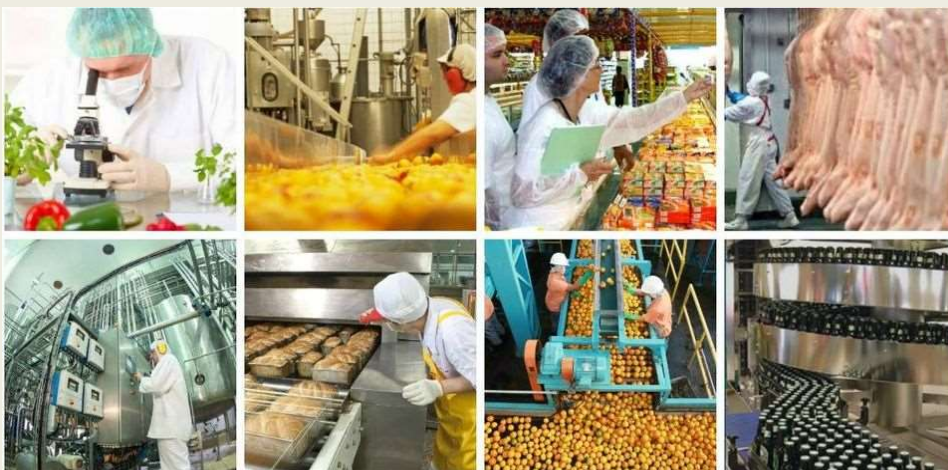
Imagem: Projeto ‘Fortalecimento e Consolidação do Curso de Engenharia de Alimentos através de Práticas de Divulgação’

A comunicação realiza-se no plano da interação entre pessoas, nos diálogos coletivos, onde o acontecimento provoca o pensamento, força-o, e espaços de interpenetração são criados. Ocorre nas formas de sociais como: