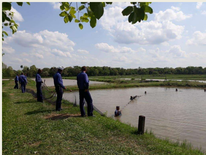
Visita técnica ao Assentamento Uirapuru. Aquidauana, MS.

De acordo com Isaac et al (2012), as atividades de extensão que envolvem tecnologia e produção situam-se no contexto dos programas de difusão tecnológica. Conforme o Manual de Oslo, envolvem um conjunto de ações simples, de baixo custo, e de alto impacto nos processos de produção e na revisão ou aperfeiçoamento de produtos das micro, pequenas e médias empresas.