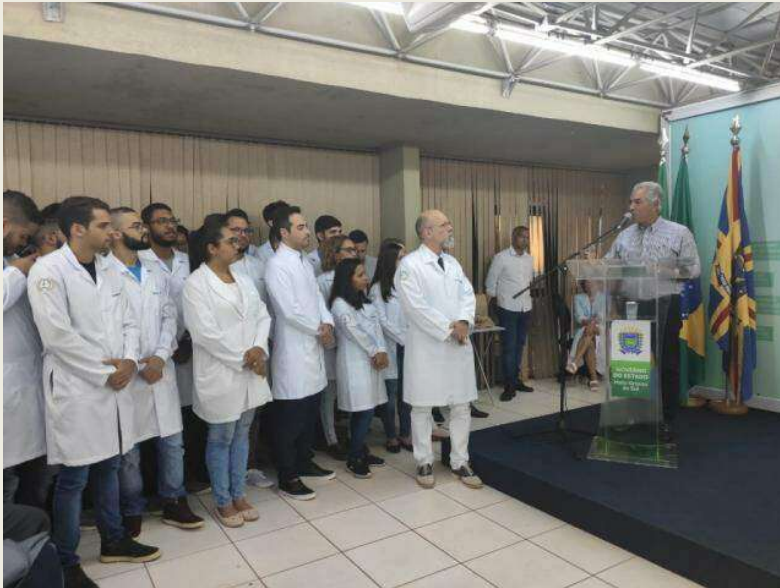
Imagem: Acadêmicos de Medicina da UEMS realizam internato no interior do estado, a partir de convênio com o governo

A palavra “trabalho” é compreendida como atividade profissional, remunerada ou não, produtiva ou criativa, exercida para determinado fim.