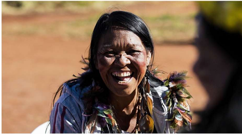
Imagem: Projeto 'OJAPO TAPE OGUATA HÍNA. Se Faz Caminho ao Andar'