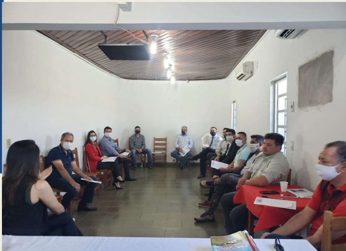
Imagem: Projeto 'Criminologia: Ações Sociais'

Os Direitos Humanos consistem nas garantias fundamentais para que todo ser humano possa viver com dignidade. São conquistas históricas que refletem o ideal comum da sociedade humana e devem ser asseguradas pelo Estado de Direito.