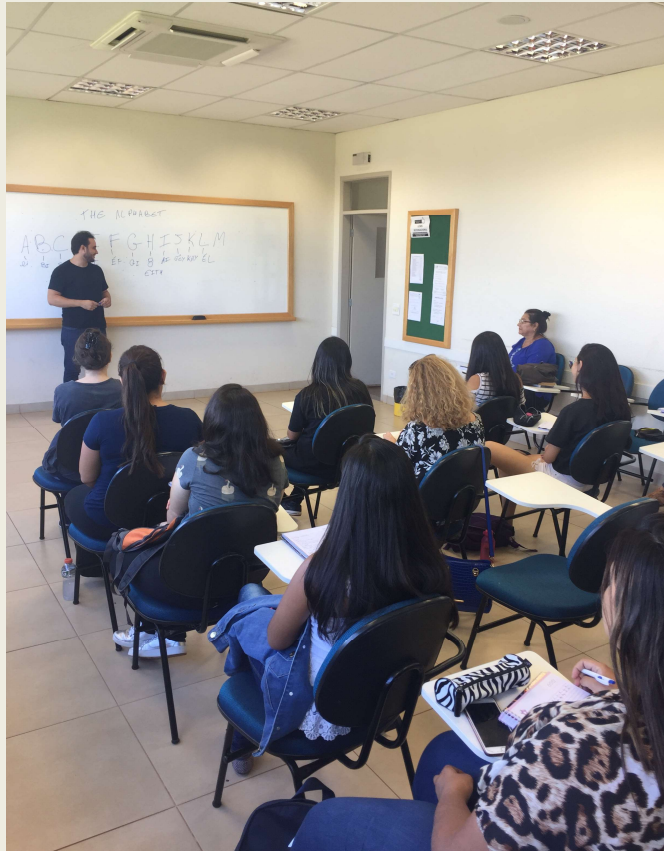
Imagem: Aula no Núcleo de Ensino de Línguas da UEMS