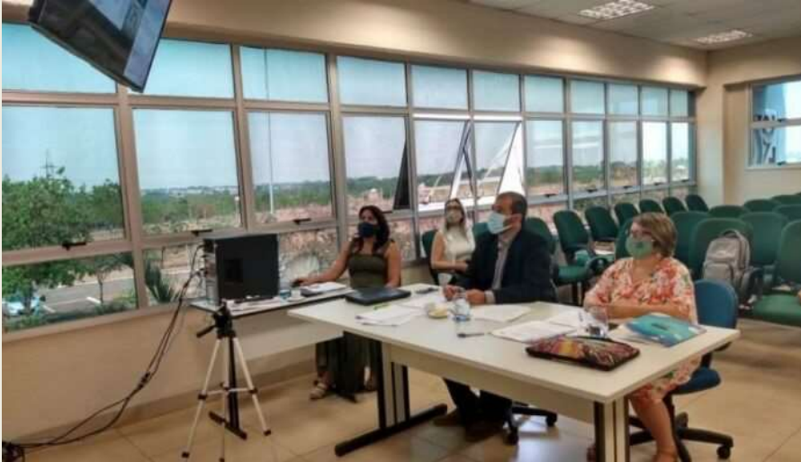
Imagem: Reunião de conselho da UEMS durante período de pandemia da Covid-19.

Foi no decorrer do século XX que o trabalho recebeu a configuração que hoje vem assumindo. Novas formas de organização do trabalho surgiram para modificar sua natureza.