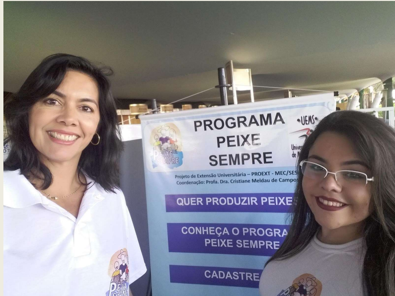
Programa Peixe Sempre- Exposição Agropecuária de Aquidauana-MS_ Programa de Extensão_PROEXT-DEX_PROEC/UEMS