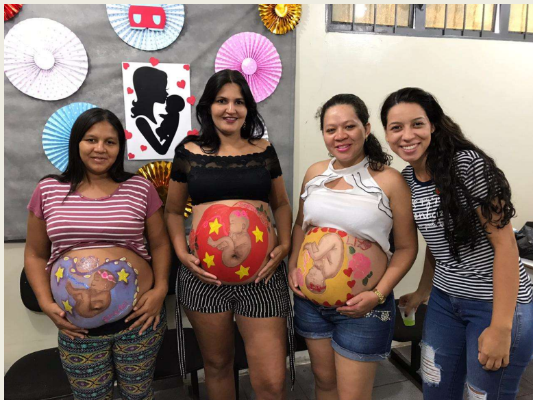
Imagem: Projeto “Grupos de Gestantes: preparo para nascimento” Curso de Enfermagem.

Saúde pode ser compreendida como o resultado de ações de cuidados individuais e coletivos que favorecem o bem-estar.