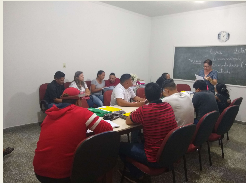
Imagem: Projeto UEMS ACOLHE – Língua Portuguesa para estrangeiros. Sala, Dourados, 2019.

Na esfera dos serviços públicos estatais, são disseminadas várias práticas pedagógicas de assistentes sociais, agentes de saúde, agentes de promoção social nas comunidades etc. (LIBÂNEO, 2001, p. 4)