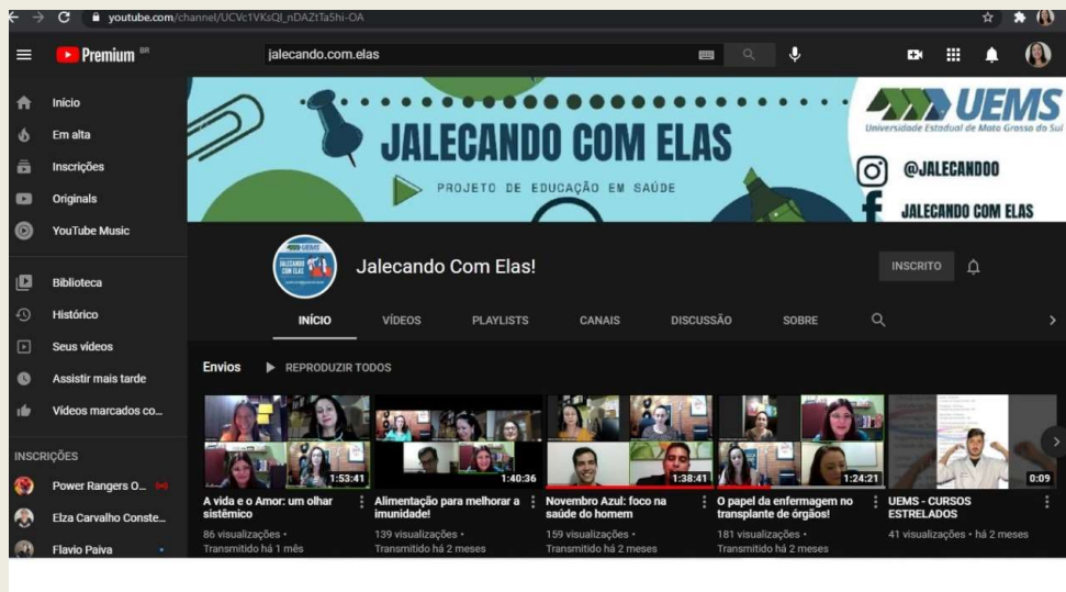
Imagem: Projeto “Jalecando com elas” Curso de Enfermagem

A Saúde no aspecto amplo do cuidado, vai além da ausência do corpo doente e sim proporcionar ao indivíduo a compreensão das suas relações sociais, familiares e relações informais, desmistificando o modelo biomédico de assistência à saúde.